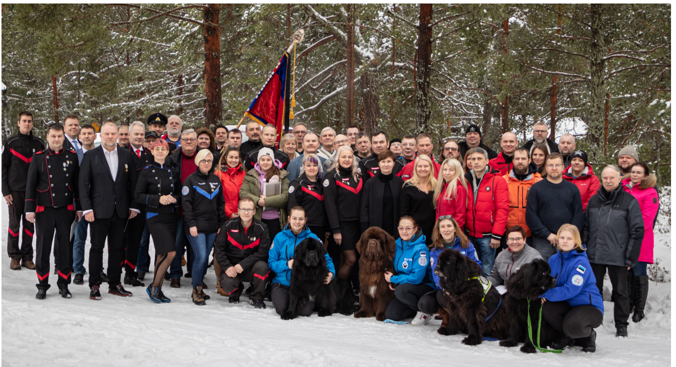
Üldkogu Roostal.