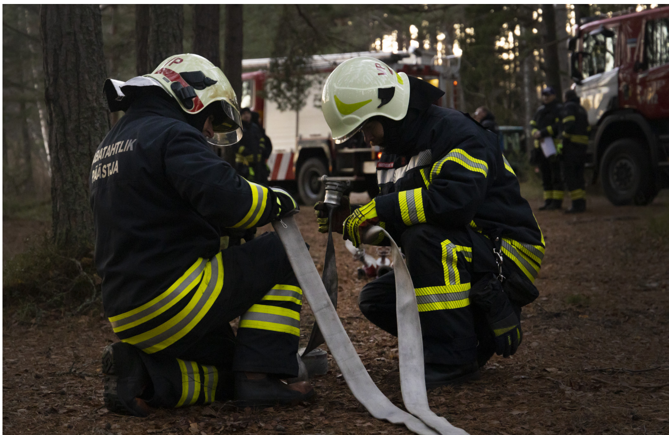
Vabatahtlikud päästjad tegutsemas.