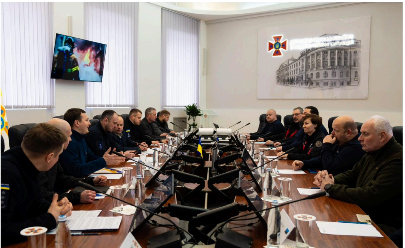
Kohtumine Ukraina päästeteenistusega suvel 2022. Autor: Päästeliit.

Päästeliidu esindus kohtus 2022. aasta juulikuus ning 2023.aasta jaanuarikuus Ukraina Eriolukordade Riiklik Teenistus juhtkonnaga Kiievis. Ühiselt arutati edasise koostöö võimalusi, mille hulgas oli soov saada päästeliidult nõu ja toetust organiseeritud vabatahtliku pääste loomiseks Ukrainas. Tähelepanu all oli mõlemal kohtumisel ka sõjast tingitud päästevarustuse vajadused, mis oli väärtuslikuks sisen-diks Päästeliidule abi koondamisel ja üleandmisel.