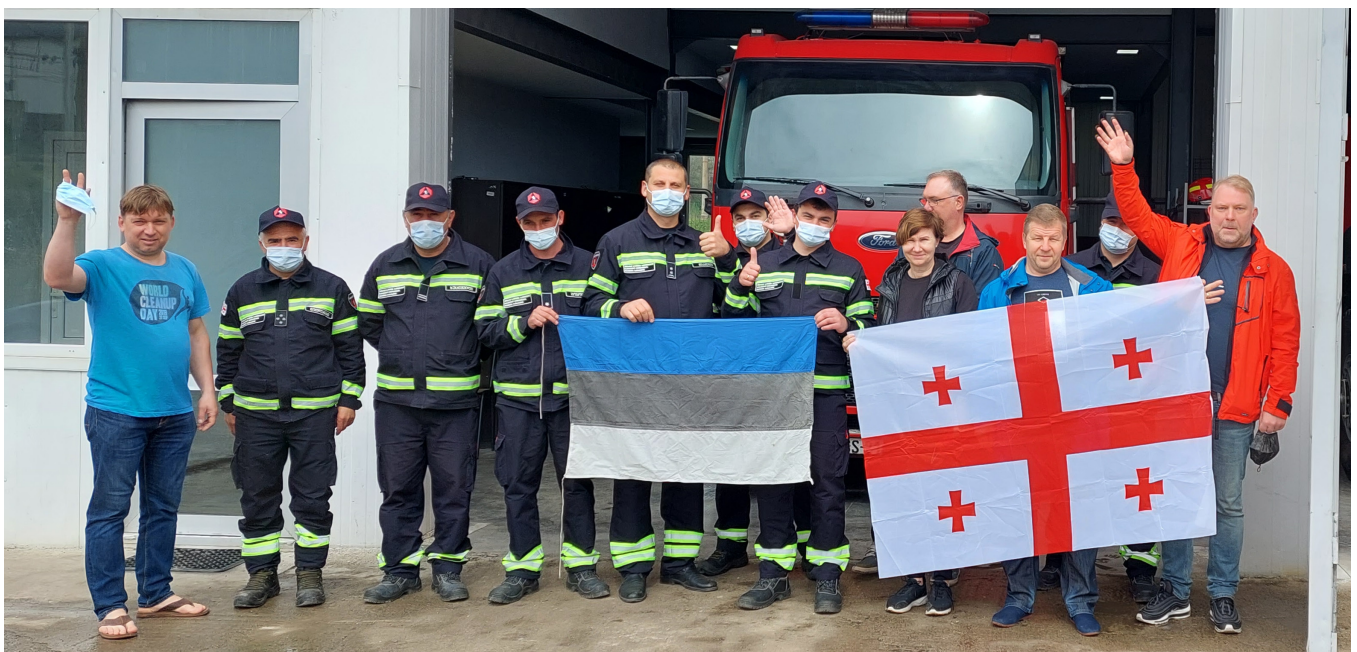
Päästeliidu liikmed Gruusias.

Projekti raames 2020. aasta novembris sõlmitud hankelepingu alusel Gruusia ettevõttega Transporter Ltd tarniti 2021. aastal kaks maastikusõidukit UTV Outlander MAX 6x6 Gruusiasse. 2021. aasta lõpus viidi läbi hange tuletuvastussüsteemi lahenduse hankimiseks, mis tarniti Gruusiasse 2022. aasta aprillikuus.