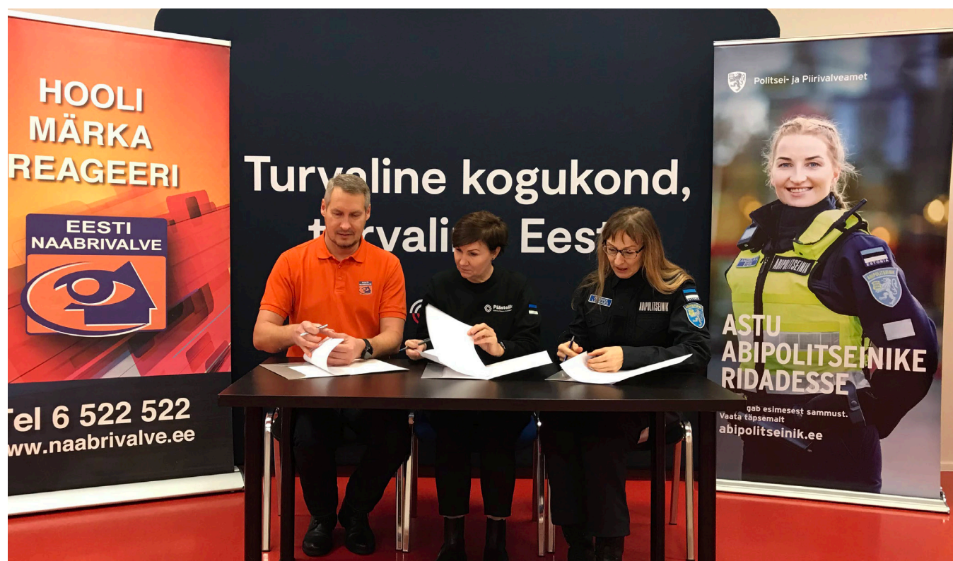
Koostööleppe allkirjastamine Naabrivalve, Päästeliidu ja Abipolitseinike Kogu esindajate poolt.