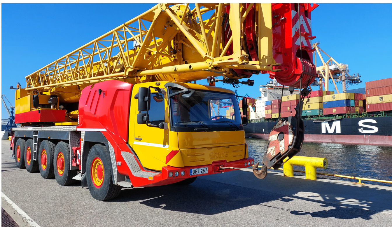
Päästeliidu poolt annetatud mobiilne kraana Taavet.

Vaatamata aegajalt tekkinud tarneraskustele ja spetsiifilise varustuse hankimise probleemidele, suudeti 2022. aasta jooksul viia ukraina päästjatele varustust kokku 4 472 403 euro väärtuses .