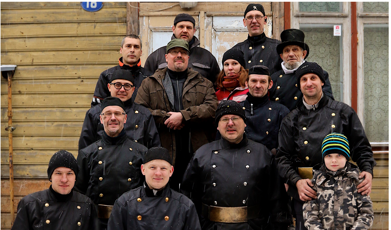
Korstnapühkijad. Autor: Pepe Sussen.

Kokku väljastati kutseid 30-le korstnapühkijale.