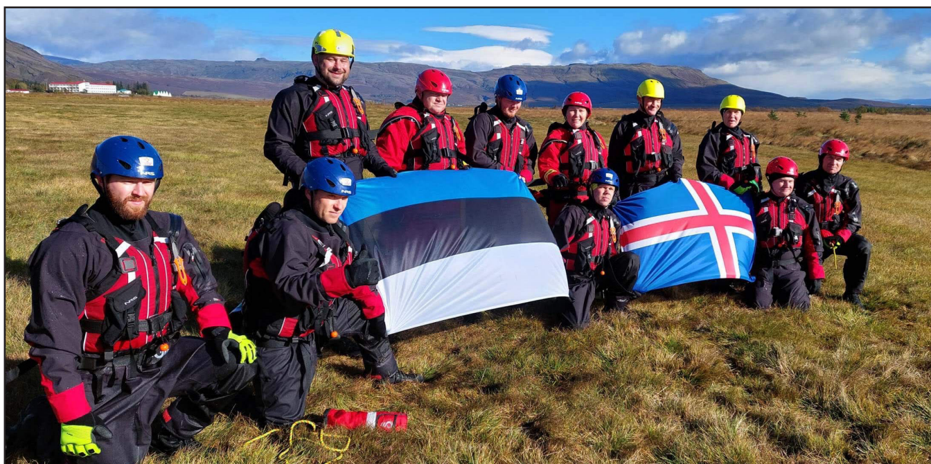
Eesti vabatahtlikud päästjad Islandil.

Lisaks osaleti oktoobris 2022 Reykjavikis toimunud rahvusvahelisel päästealasel konverentsil „Rescue 2022“.