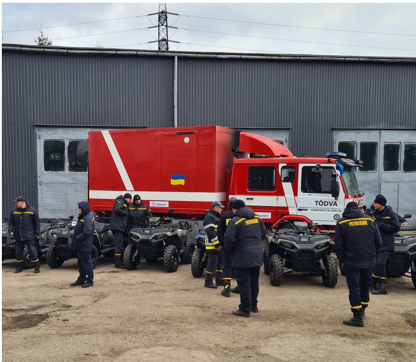
Tõdva logistika moodul Lvivis varustust üle andmas.

Logistika lahendused varustuse viimiseks Ukrainasse pakuti koheselt välja vabatahtlike päästjate enda poolt. Rohkelt kasutati Tõdva VPK logistika mooduliga päästemasinat varustuse viimiseks Ukrainasse, Lvivi. Lisaks sellele, vedasid Hüüru ja Türi ühingu vabatahtlikud varustust nii Ukrainasse kui ka Poola-Ukraina piiril asuvasse HUB-i. Hiljem kasutati koostööpartnerina ka logistikaettevõtet DSV ja teisi kaugvedudega tegelevaid teenuseosutajaid.