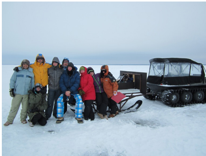
Kalapüük ja mõttetalgud sibulatalus ja Peipsil jaanuaris 2013