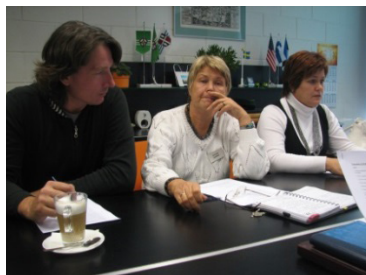
2010. aasta kokkutuleku ettevalmistamine