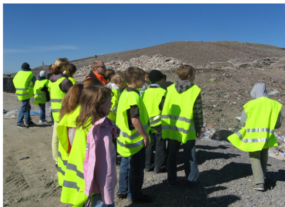
6. klass prügilä külastusel