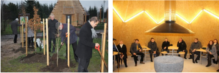
Püstkoja avamine 2. novembril 2012

Rõõmupäevadeks on alati kujunenud millegi uue avamine.