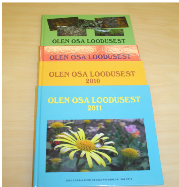
Keskkonnafoorumi raames väljaantud raamat „Olen osa loodusest“