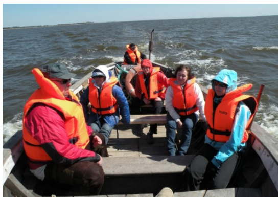
Mõttetalgud Kiideval ja merel 2009

Suured teod ei teki ilma heade mõtete, unistuste ja plaanideta. Ühise aja leidmine mõttetalguteks ei ole sageli tulnud lihtsalt, kuid juba koos olles, sünnib mõtteid ikka rohkem kui ellu viia jõutakse. Vilistlaskogul on kombeks, et mõttetalgud käivad alati koos millegi põnevust tekitavaga, huvitavate tegevustega ja avastamisega.