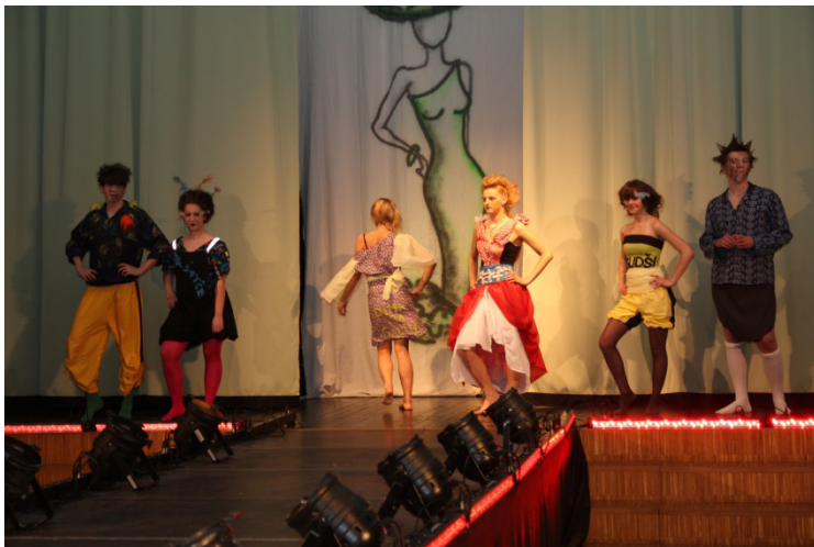
Moe-show 2010. aastal

Õpilasüritustest oleme igal aastal toetanud Rae valla koolidevahelist Moe-showd .