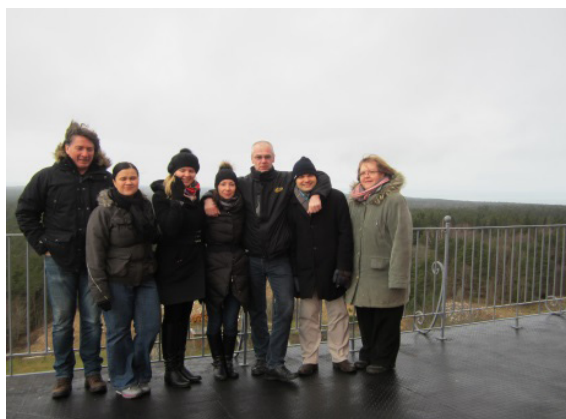
Mõttetalgud ja tutvumisreis Hiiumaaga 2015