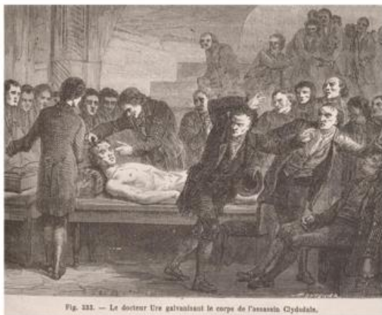
Fig. 331. — Le docteur Ure galvanisant le corps de l'assassin Clydala.