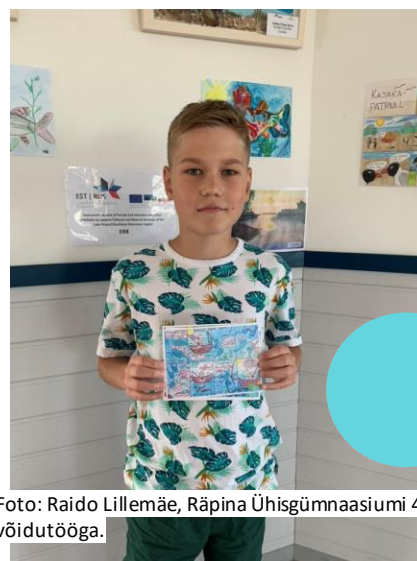
Foto: Raido Lillemäe, Räpina Ühisgümnaasiumi 4. klass oma võidutööga.