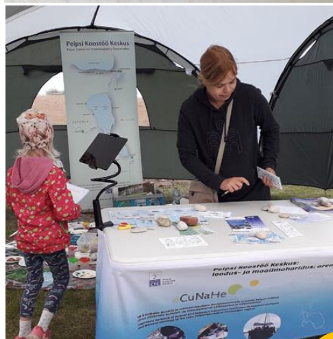
Foto: projekti CuNaHe töötuba Rápina sadamas.