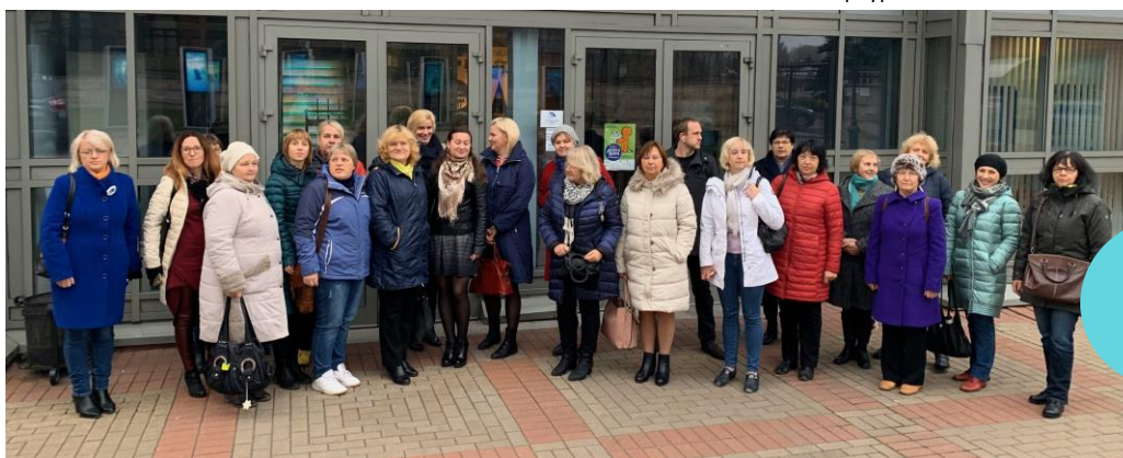
Участники учебной поездки знакомятся с мультимедийной выставкой «Вселенная Воды».