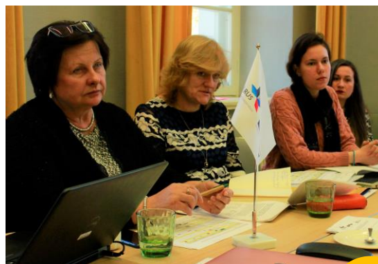
Проекта CuNaHe Рабочая встреча.

13 ноября 2019 в Ряпинской Общей Гимназии прошёл учебный день, где был проведён обзор учебных материалов и возможностей по их интеграции в повседневную школьную работу. Также были продемонстрированы возможности применения интерактивного плоского экрана, купленного при поддержке проекта, при проведении учебной работы.