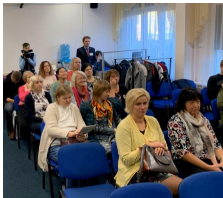
Участники учебной поездки на семинаре в школе №227 г. Санкт-Петербурга.

В дополнение к обмену знаниями и опытом, во время учебной поездки был составлен план реализации проекта на второе полугодие. Совместно были обдуманы планы для программ обучения на свежем воздухе в Ряпинской и Печорской школах, проведение открытых уроков и конкурса исследовательских работ.