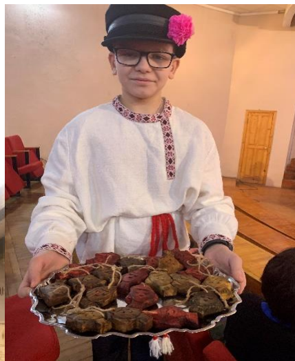
Печорский школьник преподнёс гостям частичку местной культуры и участники учебного семинара знакомятся с Музеем льна в Печорах.