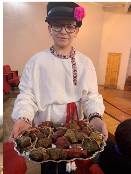
Koolitusseminaril osalejad tutvusid Petseri linamuuseumiga ja Petseri kooliõpilane pakkus külalistele killukest kohalikust kultuurist.