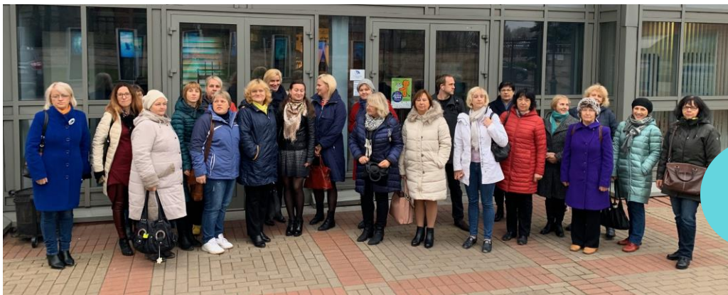
Õppereisi osalejad tutvumas multimeedianäitusega „Water Universe“.