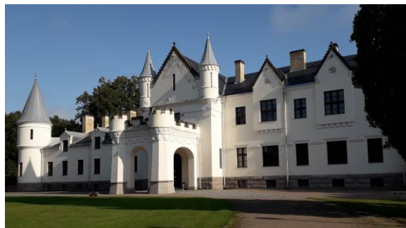
Alatskivi Loss – üks Peipsi järve piirkonna külastuskohtadest, mis peidab endas hariduslikke ja põnevaid õppeprogramme nii lastele kui ka täiskasvanutele.

Õppereisil jagatakse mõtteid naaberriikide haridussüsteemist ning tutvustatakse erivaid õppemeetodeid ning -võimalusi.