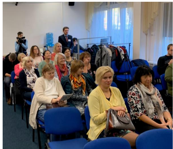
Õppereisi osalejad seminaril Peterburi kooli nr 227.

Lisaks teadmiste ja kogemuste vahetamisele, peeti õppekäigu ajal ka plaane projekti järgmise poolaasta tegevuste üle. Üheskoos mõeldi, kuidas kavandada õuesõppe programme Rápina ja Petseri koolides, avatud tunde ja uurimistöde konkursse.