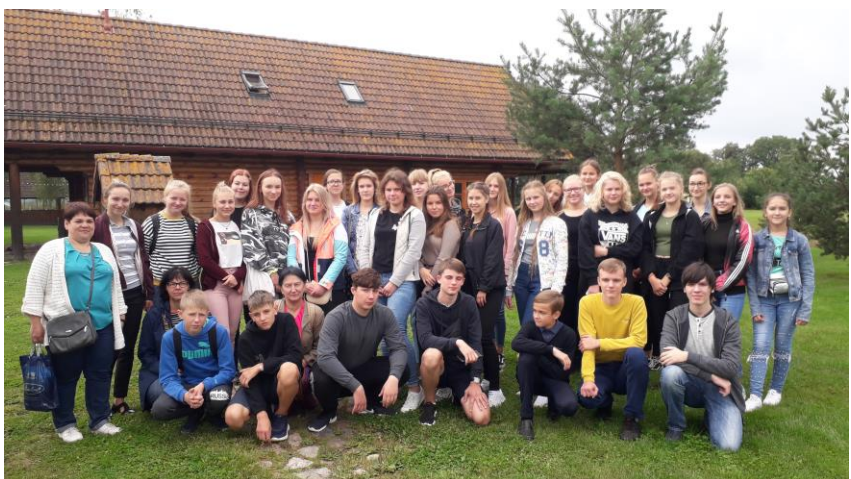
CuNaHe suvekool Räpinas tõi kokku 30 Eesti Vene kooliõpilast.

Nelja päeva pikkune suvekool tutvustas kohalikku kultuuri- ja looduspärandit. Programm sisaldas eksperimentaalset looduse õppimist, õppevisiite Tartusse ja Peipsi äärsesse küladesse. Suvekoolis kasutati uusi digitaalseid interaktiivseid töövahendeid.