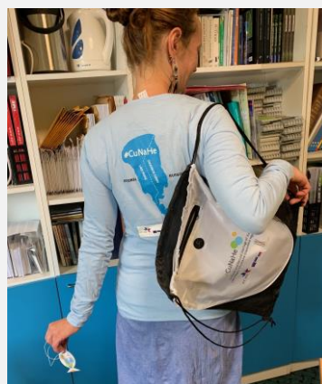
Projekti CuNaHe suvekooli meened.