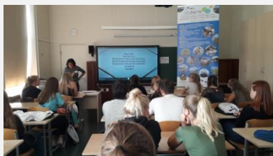
Suvekooli õpilased digitunnis.