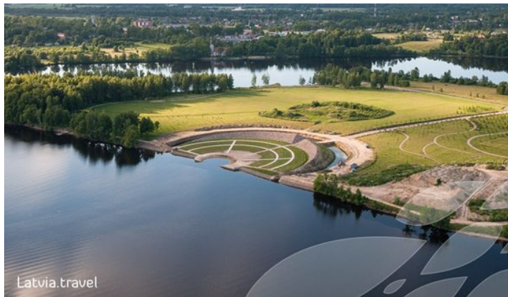
Läti “Saatuse aed”.

Konverentsi teemaks oli maastiku mälu. Minu ettekanne keskendus Maarjamäe memoriaalile ning selle paiga rohketele kihistustele. Huvitav oli kuulda lätlaste üsna sarnasest monumendist – “Liktendarzs”, mis tõlkes tähendab “Saatuse aed”. See rajati riigi 100. sünnipäeva kingitusena mälestamaks totalitaarse riigivõimu ohvreid ( http://liktendarzs.lv/us ). Mälestusmärgi idee autoriks on jaapani tuntud zen-budistist maastikuarhitekt Shunmyo Masuno.