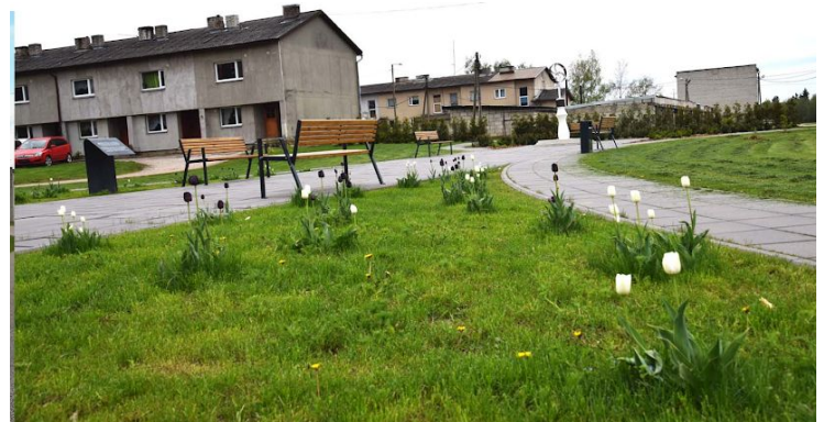
Fotod enne ja pärast

Platsi teedevõrk toetab seda, et väljakule saaks hõlpsasti läheneda igast küljest. Arvestatud on sellega, et plats asub korrus- ja individuaalelamute vahel ning et see on ehk kogu asula ainuke selleks otstarbeks loodud avalik ruum.