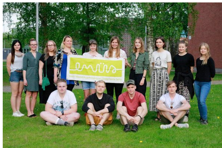
Fotol EMÜSi uus ja vana juhatus

Fotode teemaks on „Pilk üles“, kus autorid on jäädvustanud midagi huvitavat ülalpool toimuvast. Jäädvustatud fotod juhtivad tähelepanu atmosfääris olevale kasutamata ruumile ning aitavad mõista õhuruumis olevat või mitte olevat maastikuarhitektuurilist potentsiaali. Kindlasti leiab igaüks näituselt huvitavaid mõtteid õhuruumi kasutamisest.