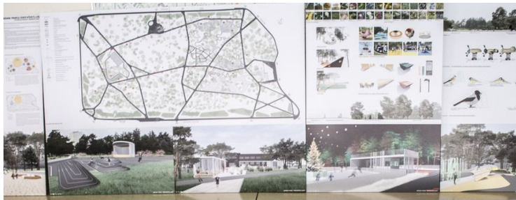
Eelmisel aastal toimunud Männi pargi ideevõistluse tööd

Võistluste töögrupis osalemise soovist palume teada anda 7. veebruariks aadressil info@maastikuarhitekt.ee