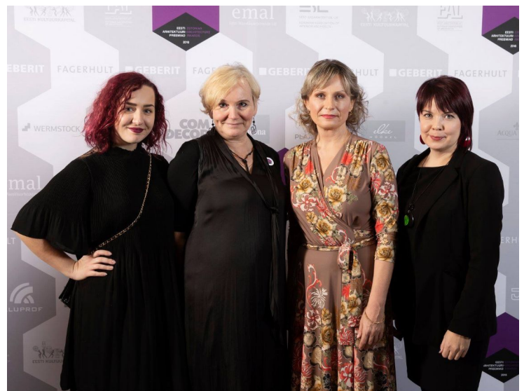
Täiskoosseisus EMALi juhatuse 2018. aasta Arhitektuuripreemiatele