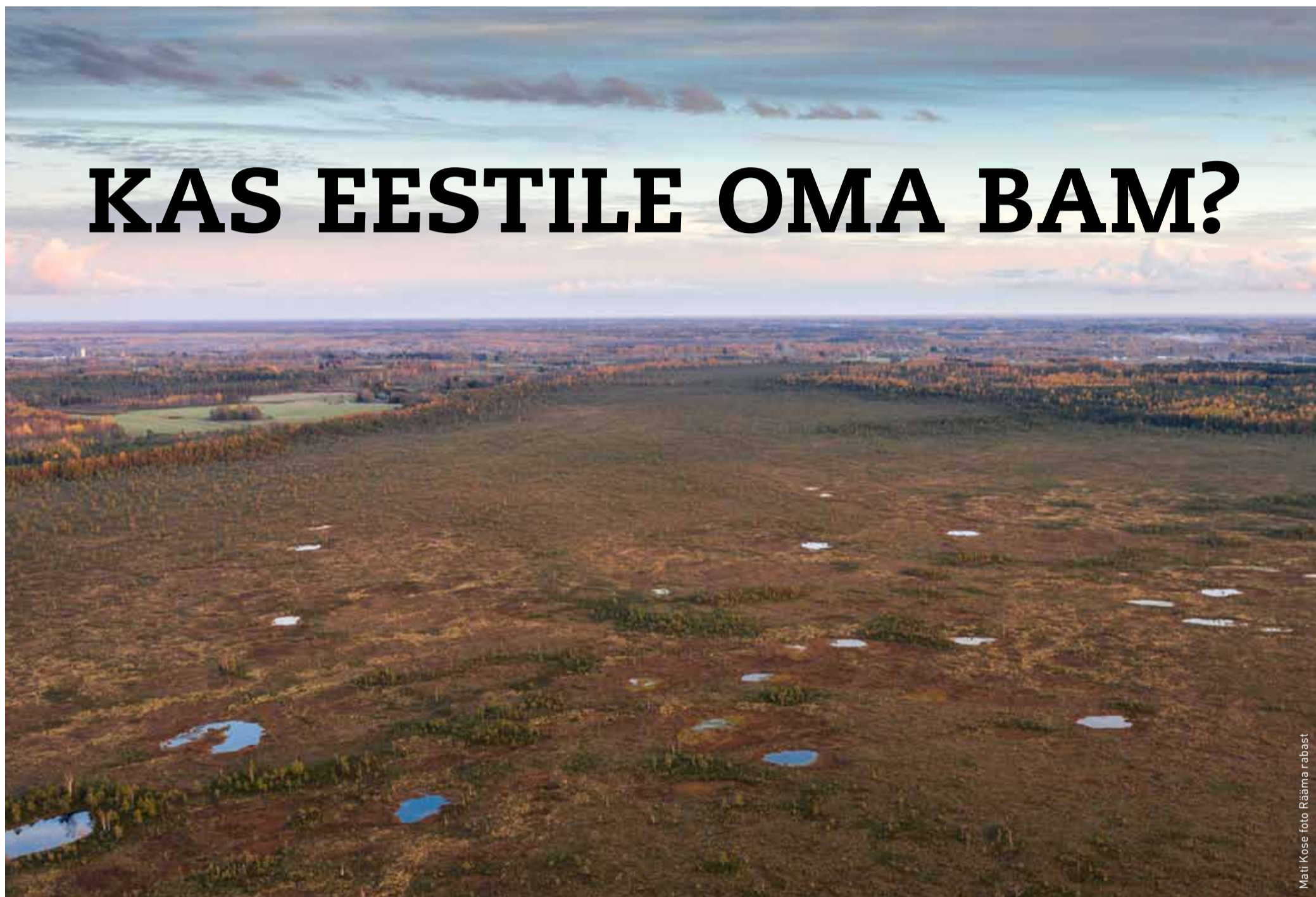
Mati Kose foto Rääma rabaast