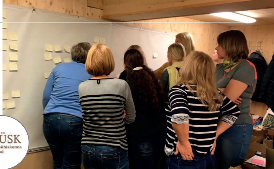
9. aprillil toimus Viljandis esimene arengutoe sessioon.

Projekti tulemusena on Varjupaikade MTÜ-s valminud realistlik tegevuskava organisatsiooni sisemise arengu ja meeskonna ühtsuse saavutamiseks.