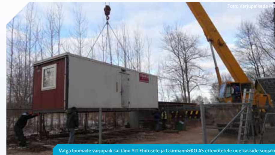
Valga loomade varjupaik sai tänu YIT Ehitusele ja Laarmann&KO AS ettevõtetele uue kasside soojaku