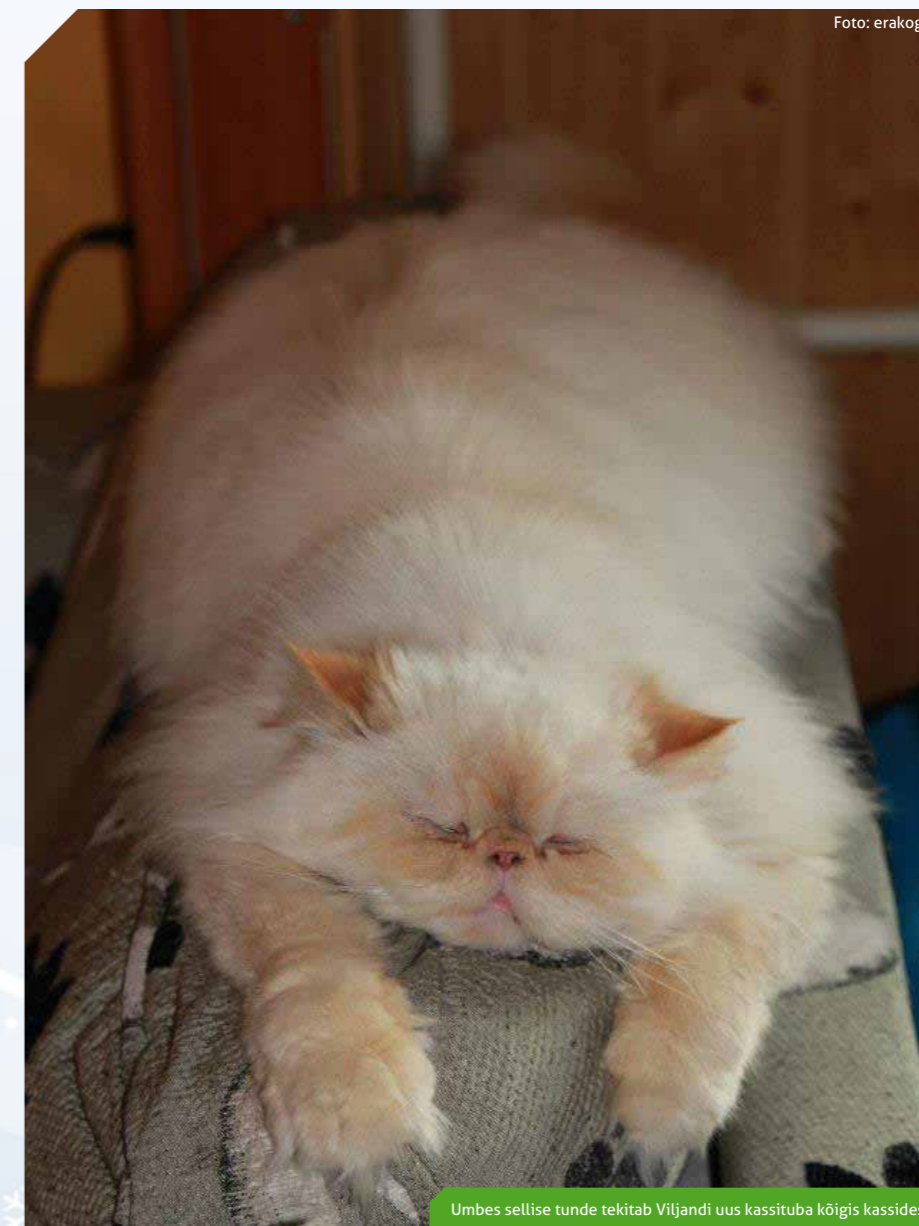
Umbes sellise tunde tekitab Viljandi uus kassituba kõigis kassides

Suurim rõõm on tõdeda seda, et sel aastal tundsin ma esmakordselt, et varjupaik on tööhoo sisse saanud, inimesed on teadlikumad oma õigustest ja kohustustest ning