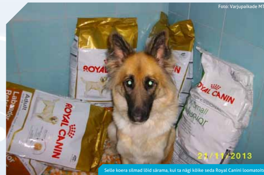
Selle koera silmad löid särava, kui ta nägi kõike seda Royal Canini loomatoitu