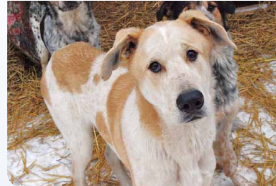
Koerte enampakkumisega osutati tähelepanu seaduste muutmiseks

Varjupaikade MTÜ otsustas jaanuaris seaduste jaburuse näitamiseks võõrandada avaliku kirjaliku enampakkumise teel 13 omanikult ära võetud koera.