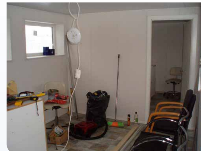
Pärnu varjupaiga uus soojak pole seest just viietärihotell, aga oma otstarvet täidab igati hästi

Kassid Pesaleidja kassituppa. Suur abi oli pesaleidja kassitua avamisest pealinnas. Viljandist sai sinna üle 20 kassi kes on meie varjupaigas pidanud aastaid puurides elama. Pesaleidjast tuleb iga nädal rõõmsõnumeid kus teatatakse mõnest "meie" kassist kes koju on saanud.