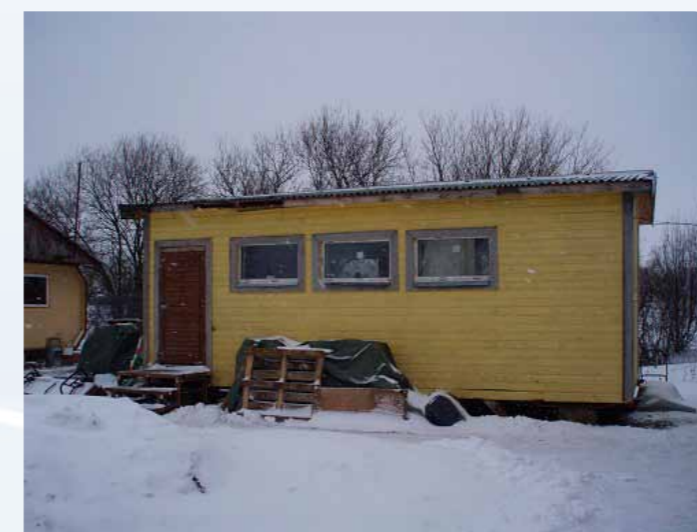
Pärnu varjupaiga uus soojak väljast