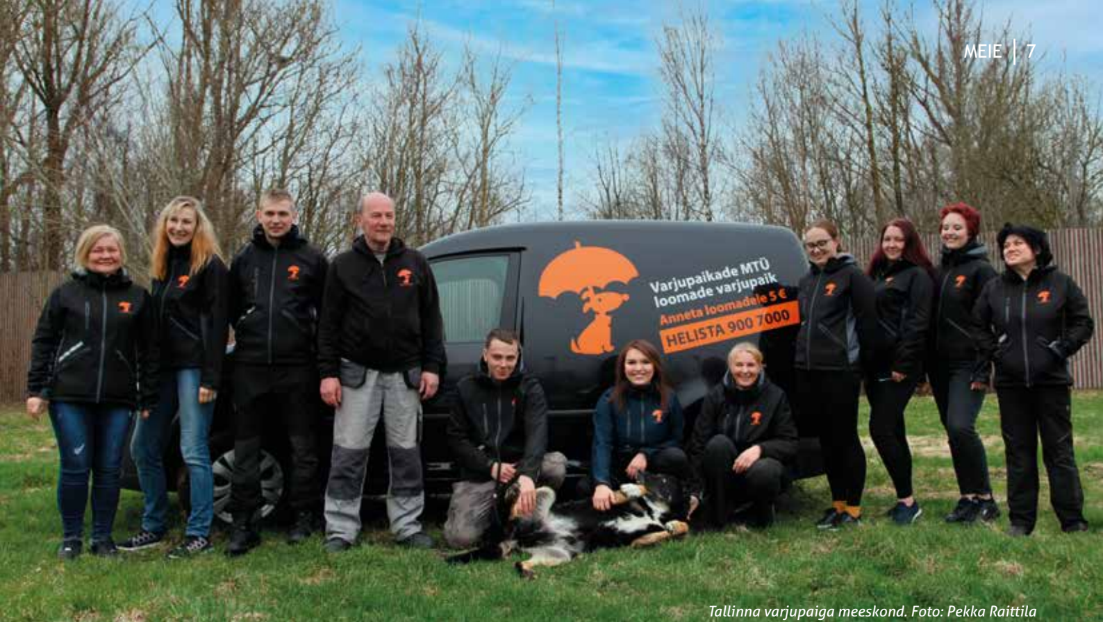
Tallinna varjupaiga meeskond.

teavitamise ja uude koju minekuni välja. Südanliigutavad on lood inimestest, kes väga pikalt oma looma ootavad, neil korduvalt külas käivad, et sõprust soetada. Ja mõned inimesed pakuvad uue kodu just vanale, eriti kaua kodu oodanud loomale.