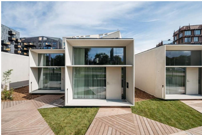
KODASTay majad Ahtri tänaval

KODASTay (kodastay.com) on lühiajalise majutusteenuse pakkuja Tallinna südalinnas Ahtri tänaval. KODASTay rendib Booking.com ja Airbnb kaudu Kodasema (kodasema.com) tehases valmistatud energiasäästlikke ja efektiivse planeeringuga maju, mida on võimalik lihtsalt liigutada ühest asukohast teise. Kuivõrd KODASTay tehnilised lahendused on uuenduslikud, sooviti ka klientide majutuste haldamiseks innovatiivset ja kuluefektiivset lahendust.