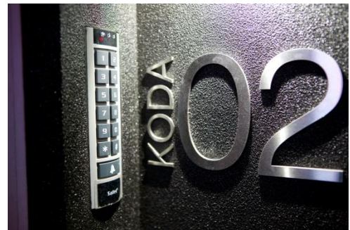
Sõrmistik läbipääsukoodi sisestamiseks