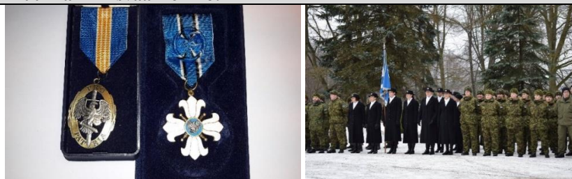
Noimile avaldatud tunnustus!

Noimi on väga aktiivne nii tööalaselt kui ka vabaaja tegevustes. Ta on aktiivne ja pika staaži ga Naiskodukaitse liige ning ta osaleb ja korraldab regulaarselt õppusi. Teda on tunnustatud mitmete teenetemedalite ja tänukirjadega. Talle anti Kaitseliidu Tartu Maleva teenetemärk ning talle on antud ka Naiskodukaitse Liiliaristi 4-da järgu medal. Noimi osaleb vabatahtlikuna kadunud inimeste otsingutel OPER-is. Ta on Securitasest töötamise ajal näidanud üles initsiatiivi ja huvi turvatöö vastu ning täidab igapäevaseid tööülesandeid suure kohusetundega ja teeb tihti rohkem, kui temalt oodatakse. Alates 2018. a sügisest on Noimi Prisma Peremarket AS kahe kaupluse objektivanem. Tänu Noimi juhendamisele on turvatöö kvaliteet objektidel oluliselt paranenud. Prisma juhtkonna poolt on palju kiidusõnu tulnud Noimi operatiivse tegutsemise kohta erinevate situatsioonide lahendamisel. Ka Politsei amet on avaldanud Noimile tänu rohkete õigusrikkujate üle andmisel ning tema meeskond kiidab teda kui head koolitajat ja abivalmis kolleegi. Kõik see väärrib Securitase meeskonna arvates laiemat kõlapinda ja tunnustust ning Eesti Parima Turvatöötaja tiitlit.