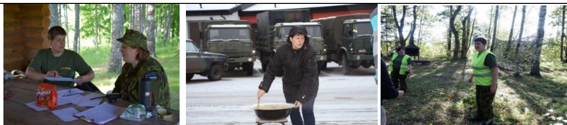
Aktiivne Noimi tegutsemas.