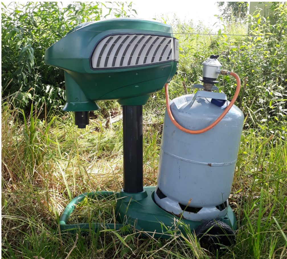
Mosquito Magnet® Independence.

keskele. Selle asemel valiti katsepunktideks loomadega asustatud aediku traadist välja jäävad kohad, mis oleksid siiski loomade puhke- ja söögikohtadele võimalikult lähedal.