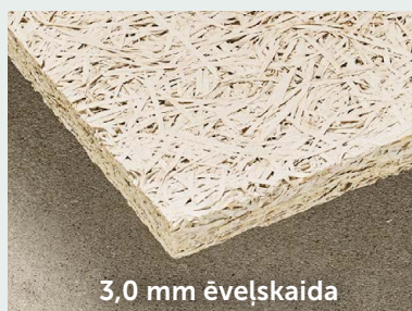
3,0 mm ēvelškaida