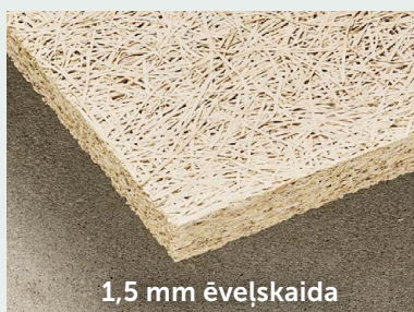
1,5 mm ēvelškaida