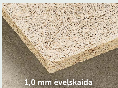
1,0 mm ēvelškaida