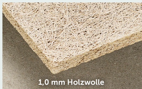
1,0 mm Holzwolle