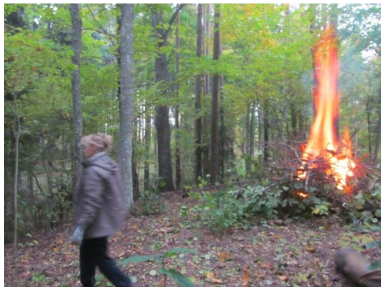
Sākas uguns saruna ar mums un kalnu...