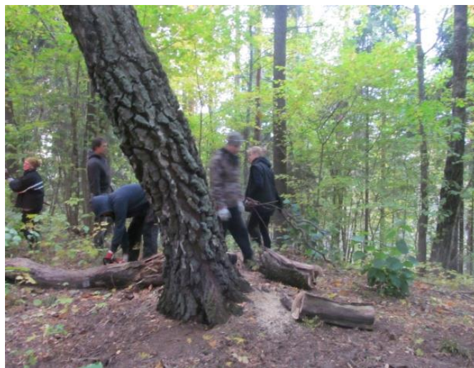
Jan kalna virsošnes attīrīšana