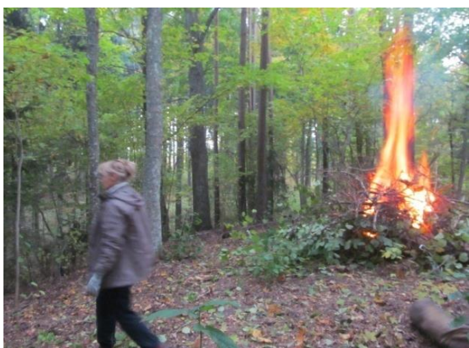
Sākas uguns saruna ar mums un kalnu...