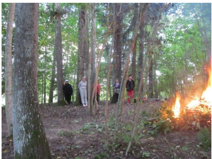
Pienācis brīdis, kad gribas pietātē un maigumā noliekties dabas un stihiju priekšā, tik vienoti klusumā ar to esam. Tie ir brīži, ko nedzēš laiks, tie ir brīži, kad pieskaramies mūžībai, kuru dēļ esam uz šo vietu nākuši.