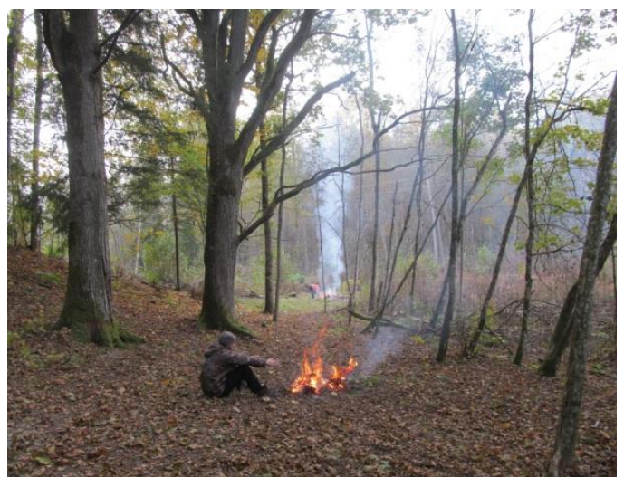
Izcirsts ceļš uz Ežakmeni...