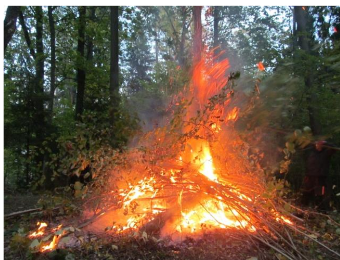
Un tā ir mīlestības valoda!