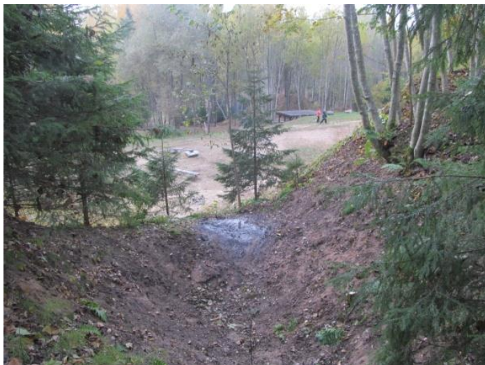
Vai nav mīļa vietīņa vientuļnieka celei?