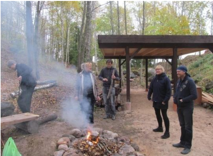
Kārtējo reizi esam satikušies, lai būtu ar sevi, dabu un viens ar otru, klusumā un kalpošanā...