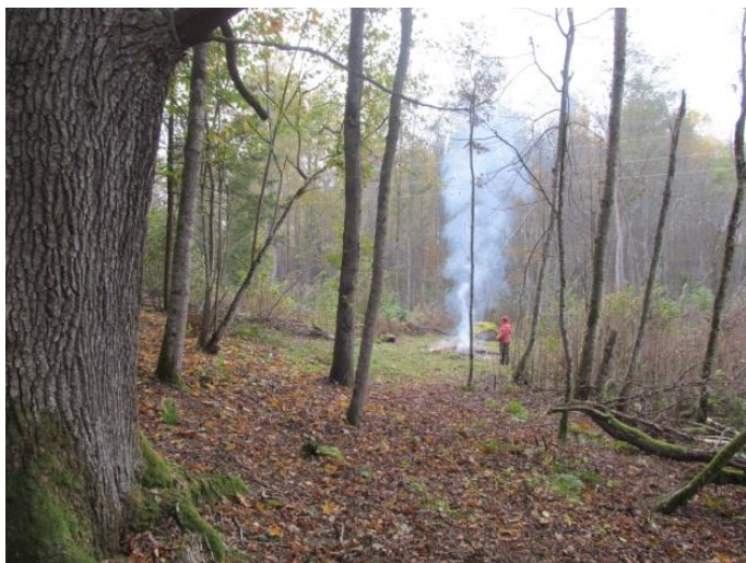
Tā vien gribas pieglausties ozolam un ļauties viņa sakņu apskāvienam