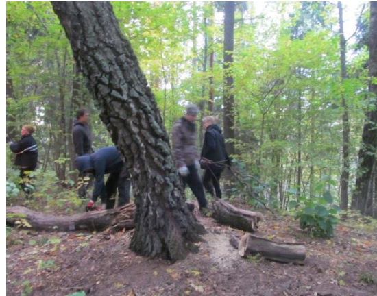
Jankalna virsotnes attīrīšana.