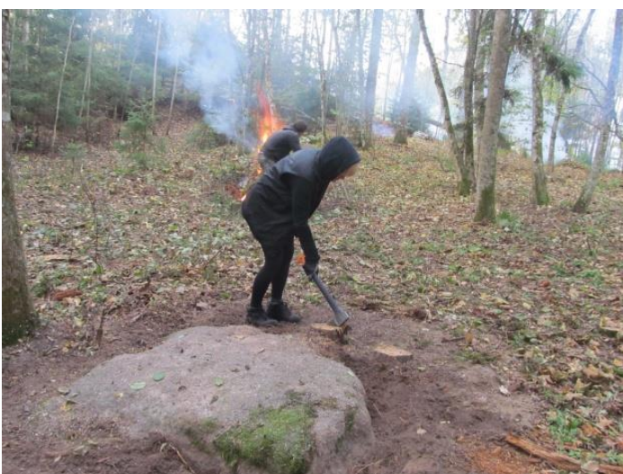
Kalns mūs nebeidz pārsteigt un apdāvināt.