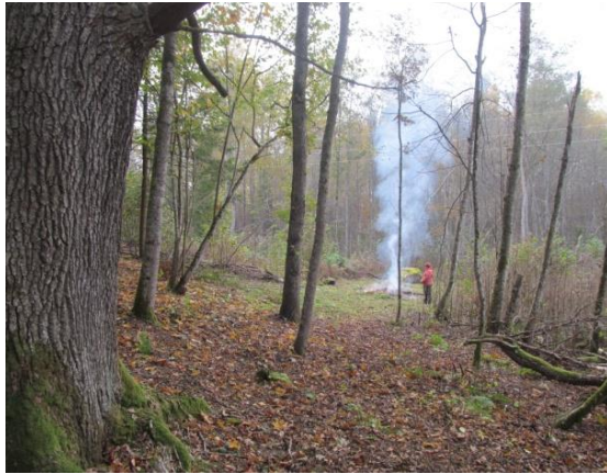
Tā vien gribas pieglausties ozolam un ļauties viņa sakņu apskāvienam.