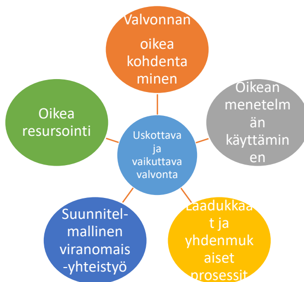
Kuva 1. Uskottava ja vaikuttava valvonta koostuu suunnittelusta, osaamisesta ja käytännön toteutumisesta.

Lainsäädännön muutoksella on tarkoitus kohdentaa pelastuslaitoksen valvonta nykyistä paremmin alueen riskien ja muiden erityisten valvontatarpeiden mukaisesti sekä vapauttaa resursseja mm. turvallisuusviestintään ja muiden viranomaisten ja yhteistyötahojen ohjaukseen.