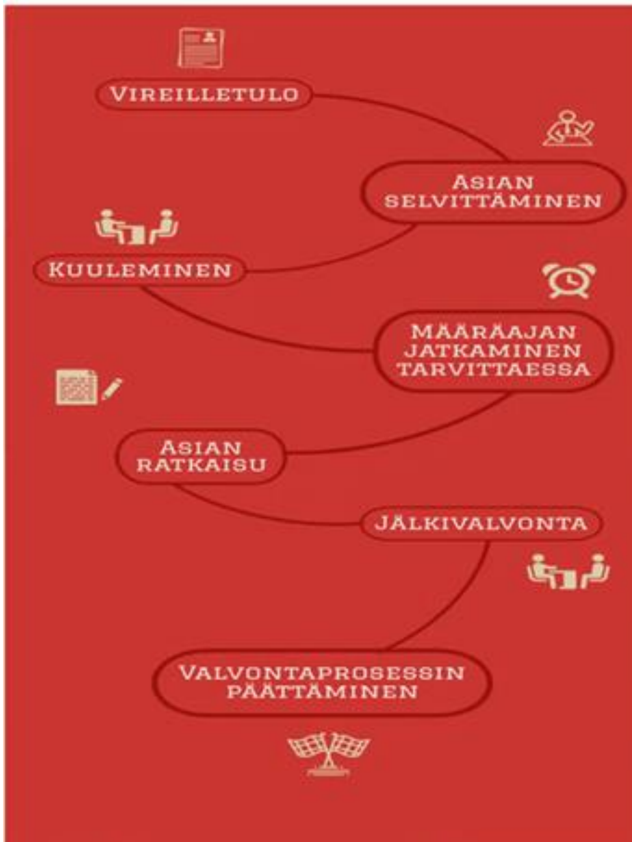
Kuva 3. Kumppanuusverkostossa käyttöön otettavaksi hyväksytty määräaikaisen valvonnan prosessi