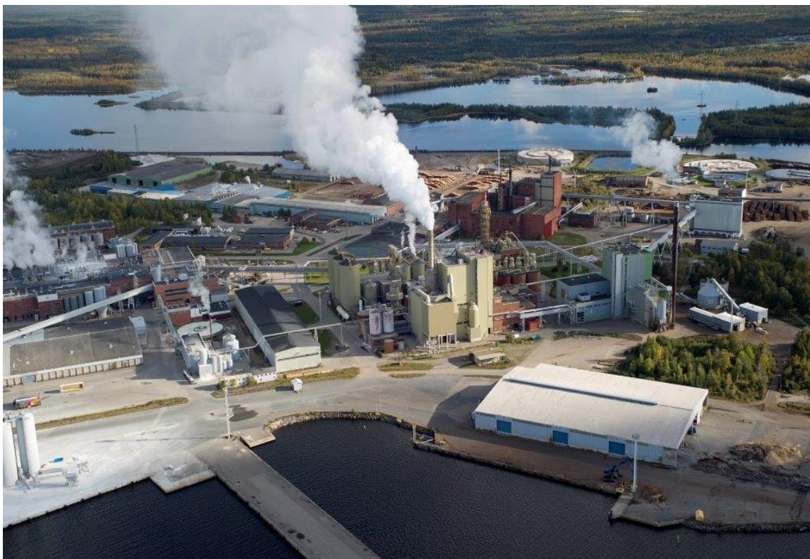
Kuva 1. Ilmakuva Veitsiluodon sellutehtaasta