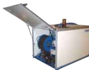
PPL 180/90 -K