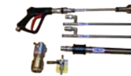
HPW противопожарный пистолет комплект противопожарный пистолет комплект HPW fire fighting pistole kit