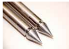
Распылитель для пробивания стен