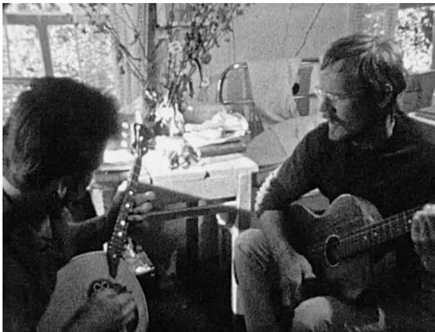
Kristaps Epnars Forget Me Not. Sleeping Sajan. Photo and video stills