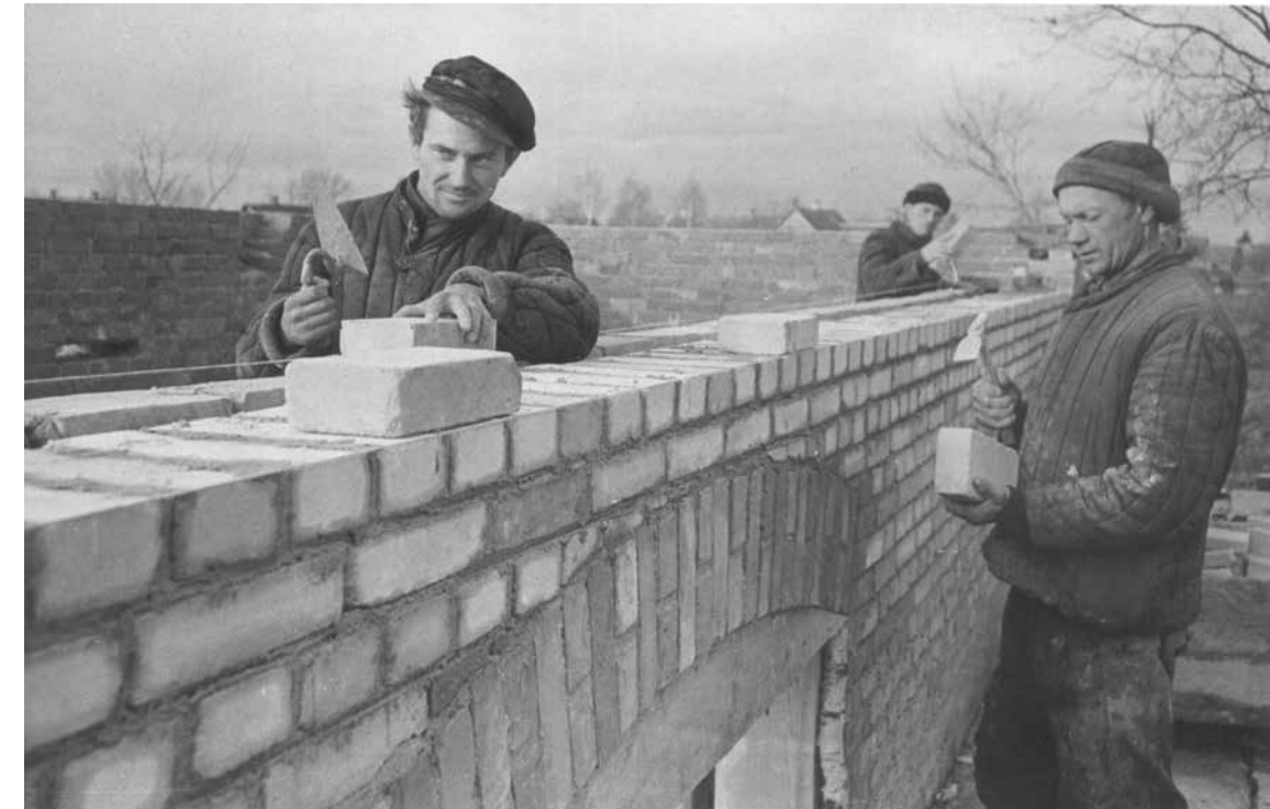
Räpina rajooni Lenini nim. kolhoosis ehitatakse uut elektrijaama 4.11.1954.a. (VK F 970-79 F). V6rumaa Muuseum Näitus „Pikiirijooksja, rotipüüdja ja müüriladuja” / Exhibition Runner Along the Border, Rat Catcher and Bricklayer

For me, the central task in curating is to give the artist the opportunity to create a new work. I attempted this here, too, but because putting an exhibition together involves many variables, you have to be willing to compromise. In addition to the artists’ works, I have selected about a dozen photos from the collections of Estonian memory institutions. While the line between ‘real’ stories and fiction is blurred when it comes to works of art, this is not the case with historical photos, at least not when looking at them superficially. But therein lies the charm of curating: having narrowed, figuratively, a million photos down to a handful for the exhibition, each of them becomes extremely meaningful and ceases