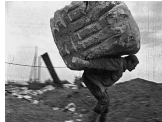
Kristaps Epnars Forget Me Not. Sleeping Sajan. Photo and video stills