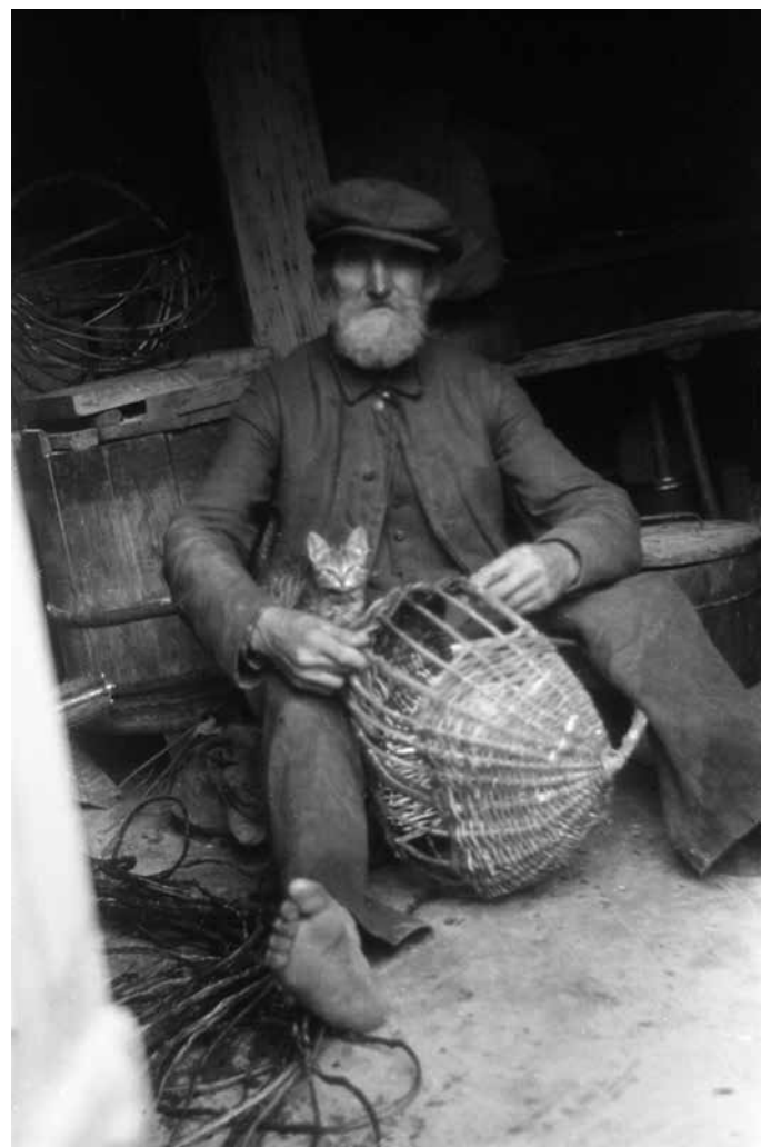
Korvipunuja kassiga (ÜAM F 507-240 F). ÜAMF506_240_UTKald_KE1R009_08. Tartu Ülikooli muuseum.