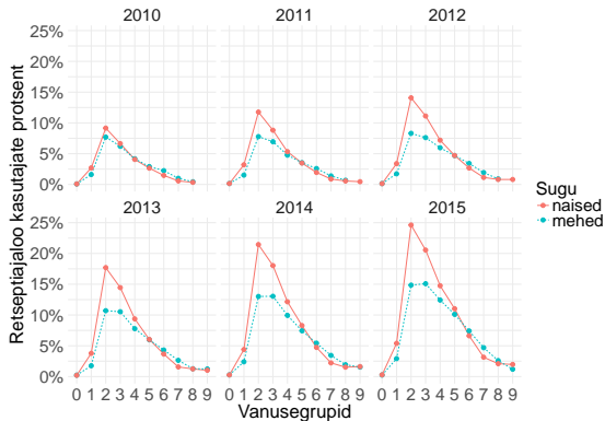
Joonis 3: Retseptiajaloo kasutajate protsent retseptiravimite kasutajatest.