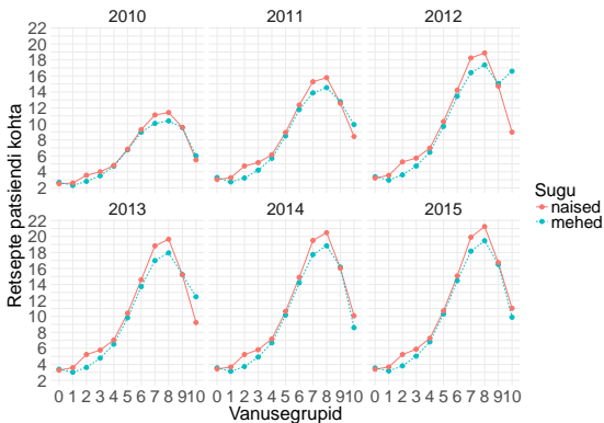
Joonis 2: Retseptiravimeid patsiendi kohta. Vanuse detiilid on arvatatud 0st alates. Näiteks 0-9, 10-19 jne.