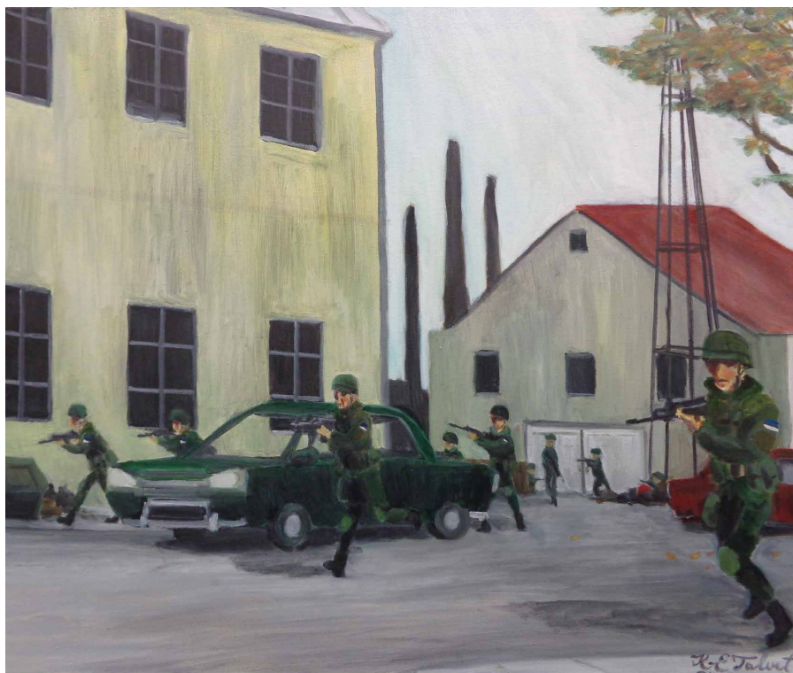
Linnalahing õli lõuendil 60 x 70 cm 2013