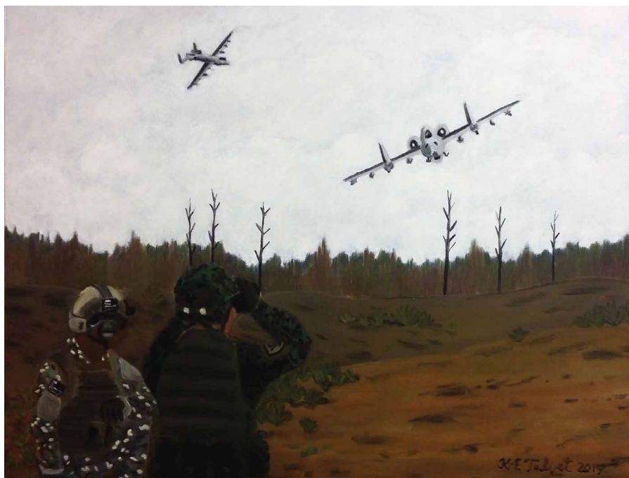
Tulejuhid õli lõuendil 70 x 90 cm 2017