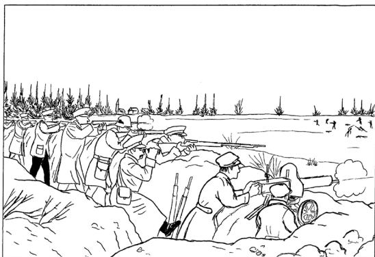
Lahinglaskmised õli lõuendil 2 x 80 x 100 cm 2018