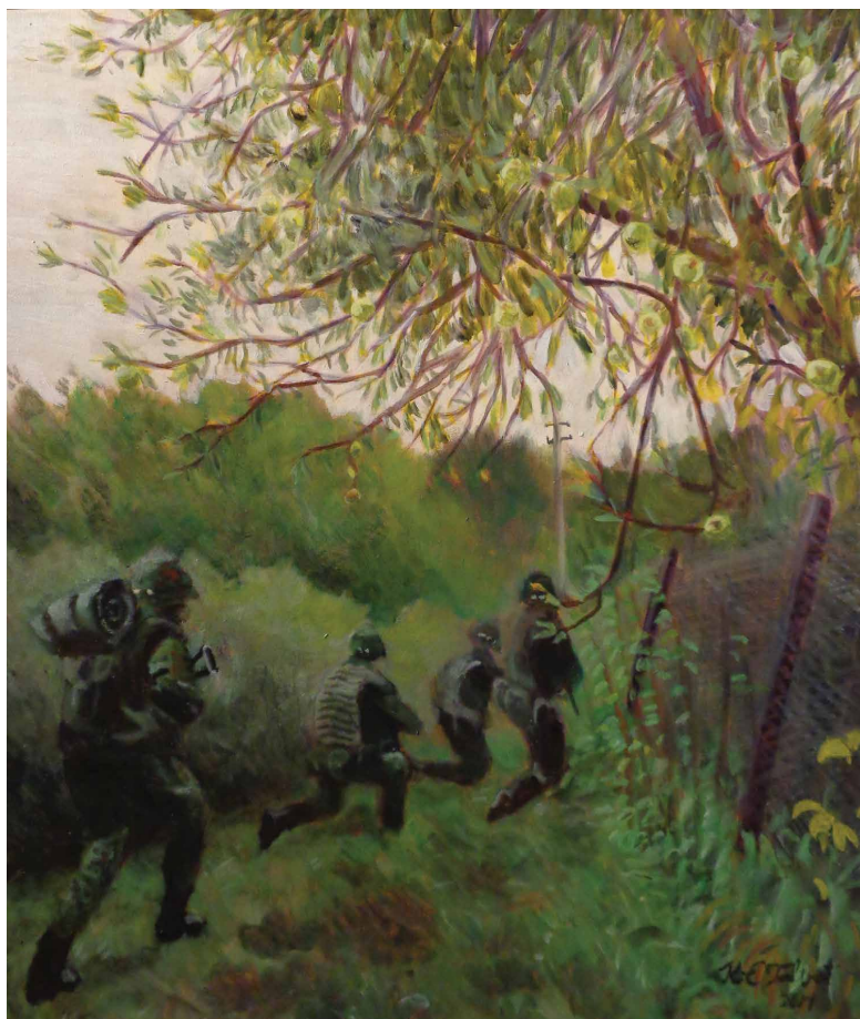
Õunapuu all õli lõuendil 70 x 60 cm 2014