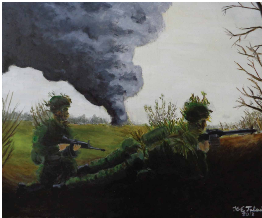
Suitsukate õli lõuendil 60 x 70 cm 2013