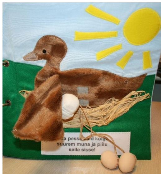
Puuteraamatud "Mutionu pidu" ja "Inetu pardipoeg" (Tiia Artla)