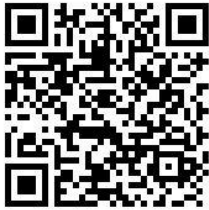
“Mutionu pühadepidu” (täiskasvanutele)