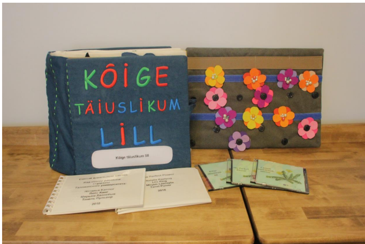
Puuteraamat ja mäng (erakogu)