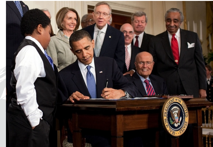
Am 23. März 2010 unterzeichnete Präsident Obama den höchst umstrittenen Patient Protection and Affordable Care Act , der als ObamaCare in die Geschichte der US-Sozialpolitik eingegangen ist.