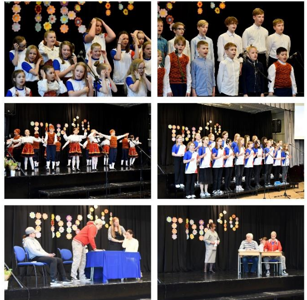
NÕ22 ehk Näitlevad Õpetajad aastal 2022

Mäletatavasti oli NO99 projektiteater, mille erilisus ja kohati isegi pöörasus jäi eesti teatrikülastajatele hästi meelde.