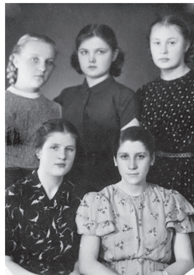
Fotol on Kiviõli II Keskkooli 10. klassi neiud 1959. aastal. Minu vanaema on ülevalt reast vasakult esimene.

Kuna juba algklassides teadsin, et tahan saada õpetajaks, siis tekkis probleem, kuhu sammud seada. Tartusse ei võetud mind vastu, sest ma ei olnud võimeline eesti keeles kirjutama. Leningradi ei julgenud minna, liiga majesteetlik. Alles jäi veel Pihkva. Esimesel aastal jäin konkursist välja, sest oli palju sisseastujaid. Kuid minu eesmärk oli saada matemaatikaõpetajaks. Sügisel läksin apteeki fassijaks, aga see aeg jäi lühikeseks. Oandu 7-klassilisse kooli oli vaja vene keele õpetajat ja sinna ma läksingi. Ilus koht! Kiviõlist 14 km kaugusel. Praegu on selles majas RMK keskus. Sellel ajal ei olnud koolis elektrit ning õppetöö algas päevavalgusega. Vene keelt tuli õpetada viiendates, kuuendates ja seitsmendates klassides. 5. ja 6. olid liitklassid. Kuna ma tahtsin minna edasi õppima matemaatikat, siis mul jätkus jultumust paluda veel lisaks ka matemaatika tunde, need ma ka sain. Ma tulin toime. Tunnis oli täielik kord