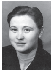
Malle pärast kõrgkooli lõpetamist Siberis.