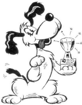
RAKVERE DOUBLE SHOWS

male babypuppies, female babypuppies; male puppies, female puppies; males: in junior, intermediate, open, working, champion and veteran class; females: in junior (+BOB/BOS Junior); females in intermediate, open, working, champion and veteran class (+ BOB/BOS Veteran); Best of Breed / BOS, couple competition, breeders class and progeny class