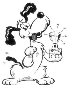
RAKVERE DOUBLE SHOWS

During the shows only for emergency call ph (+372) 521 9294