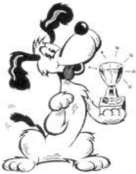
RAKVERE DOUBLE SHOWS

During the shows only for emergency call ph (+372) 521 9294