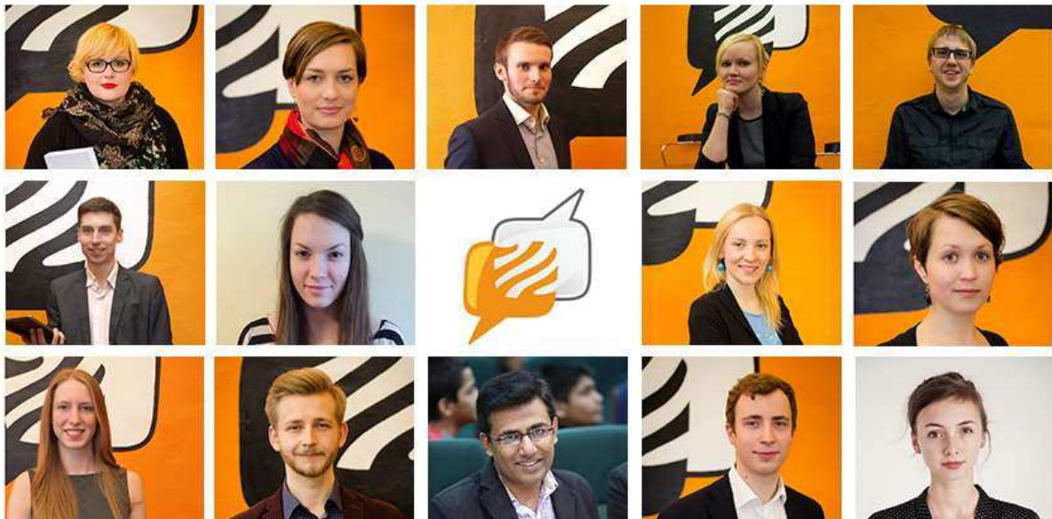
Meeskond 2017. aastal

Meie meeskond on välja kasvanud ja kantud jagatud väärtustest, mis tulenevad meie ühisest taustast ja teemast, mida õpetame – argumenteerimine ja ratsionaalne mõtlemine. Need jagatud väärtused on tolerantsus, avatus, ausus, sisulisus/ tõendus põhisus, sõnavabadus, kaasatus, inimkesksus/kliendikeskus.