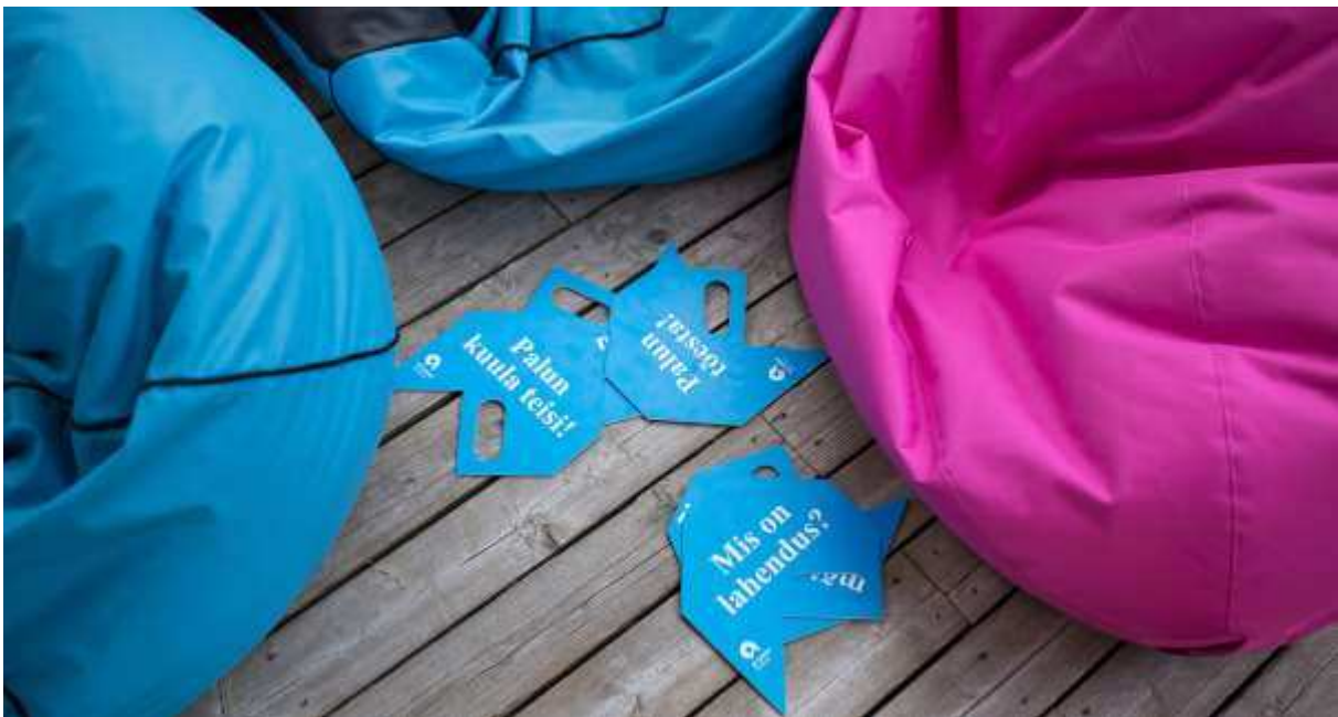
SpeakSmart arutelusildid Arvamusfestivalil 2017.