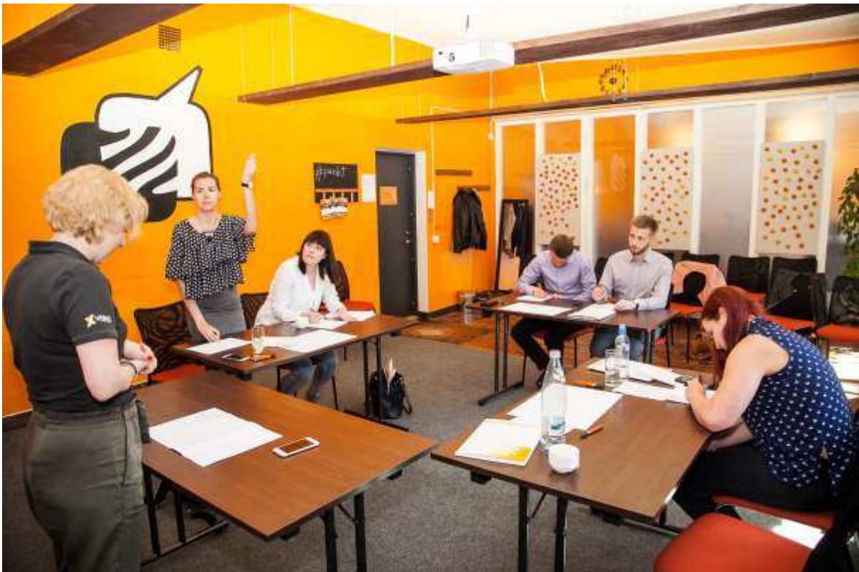
PUNKT 2017 väitlusturniir.

Soovides ühiskonnas populariseerida võistluslikku väitlust kui mõttesporti, korraldame igal aastal ettevõtete, asutuste ja vabaühenduste vahelist väitlusturniiri PUNKT . Esimesel turniiril 2016. aasta 11. juunil osales 12 meeskond ning turniiri võitis Vabaühenduste Liidu meeskond. Teine turniir toimus 10. juunil 2017 ja osales 6 meeskonda, võitis võistkond Spontaanne. Turniiri kodulehekülg .