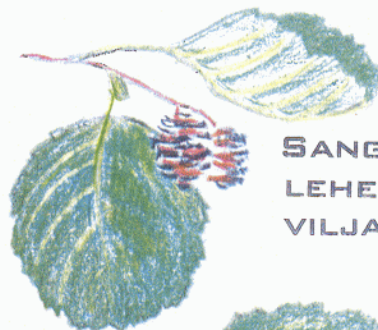
SANGLEPA LEHED JA VILJAD