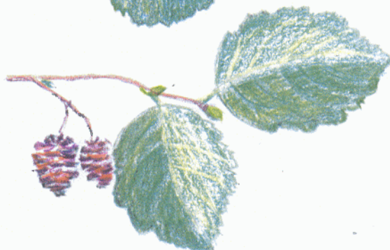
HALLI LEPA LEHED JA VILJAD