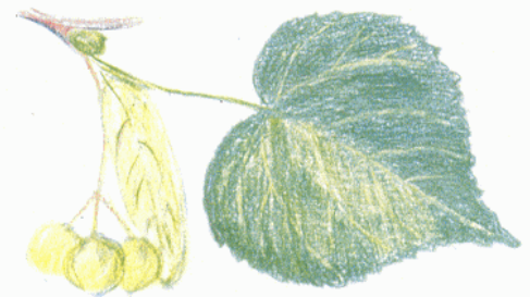
PÄRNA LEHT KOOS VILJAGA