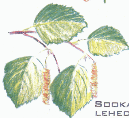
SOOKASE LEHED JA VILJAD