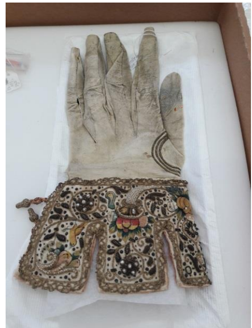
Rijksmuseumis, näidis nõuetekohaseest pakendamisest