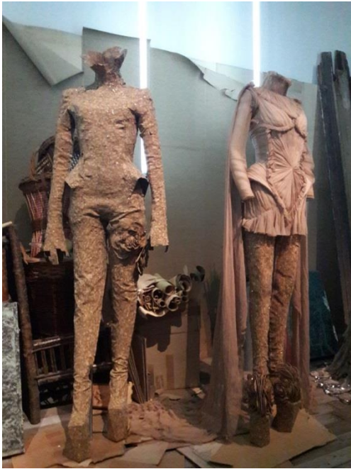
Jan Taminiau näitus, inspiratsiooniks oli vanaema pööning