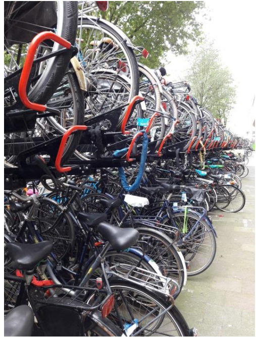
Utrechti tänavapilt, rattaparkla