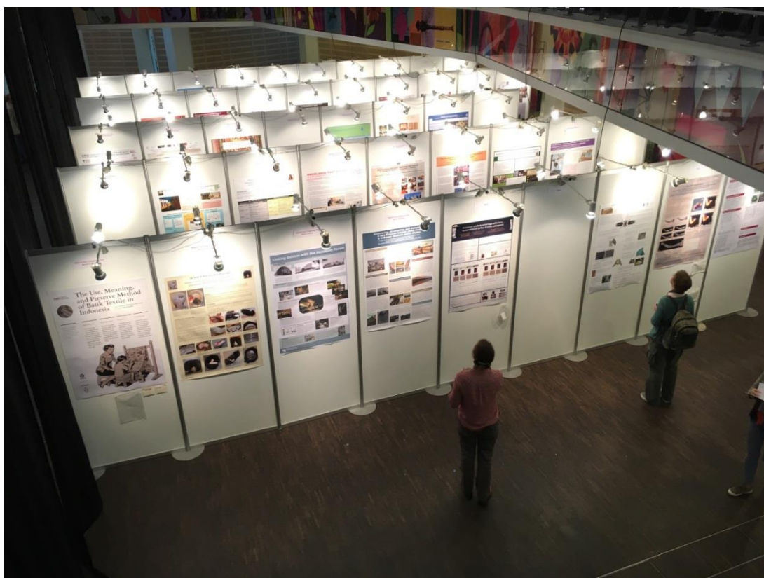
Vaade plakatite väljapanekule.