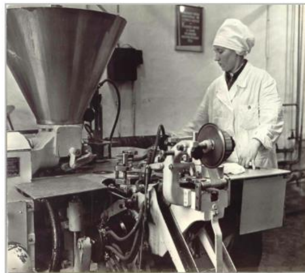
Viljandi PTK Õisu tsehh (EPIM FK 162); Eesti Piimandusmuuseum SA; EPI_MFK162_1_pisipilt.jpg