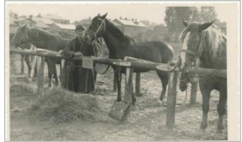
Sovhoosi "Tahe" hobused (VaM F 353:10); Valga Muuseum; VaMF353_10_pisipilt.jpg