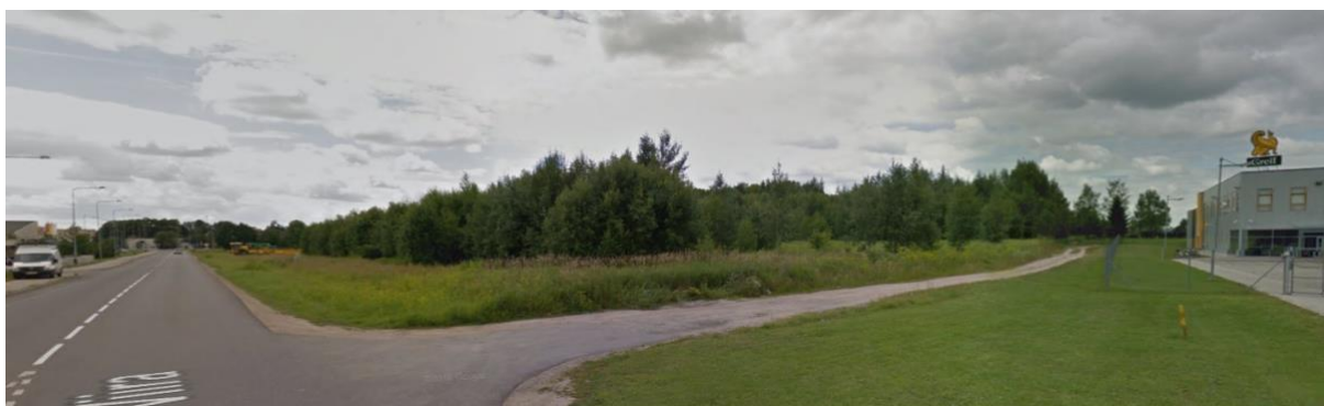
Pilt 2 Vaade planeeringualale kirdest

Planeeringualale ulatuvad 22253 Rõõmu-Viira tee kaitsevöönd 30 m tee äärmise sõiduraja välimisest servast, Tartu Rahumäe kalmistu kinnismälestise kaitsevöönd ning tehnovõrkude kaitsevööndid (vt joonis 2).