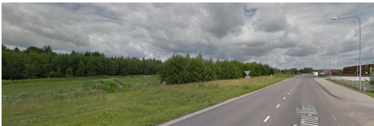
Pilt 1 Vaade planeeringualale kagust 22253 Rõõmu-Viira teelt

Maa-ala on osaliselt looduslik lage ala, mida piiritlevad puistud, mille valdavaks puuliigiks on arukask ja hall lepp. Pajula tee 2 katastriüksuse idapoolsel osal piki 22253 Rõõmu-Viira teed kasvab ca 120 m pikkune ja 10 m laiune halli lepa ja arukase enamuspuiduga noorendik. Pajula tee 2 kü. läänepoolsel osal kasvab ca 30 laiune põhja-lõuna suunaline noorendik, mis moodustab visuaalse barjääri surnuaja ja planeeringuala vahele. Ala reljeef on suhteliselt tasane. Maapinna kõrguste vahe on maksimaalselt ca 1 m.