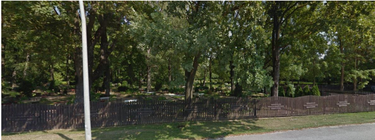
Pilt 6 Rahumäe kalmistu, mis asub planeeringualast läänes

Rahumäe kalmistu on kultuurimälestis, mille kaitsevöönd 50 m ulatub planeeringuala lääneosale. Muinsuskaitse eritingimustest lähtuvalt on soovituslik säilitada maksimaalselt olemasolev puistu kalmistu idaküljel, mis loob visuaalse barjääri lasteaia ning kalmistu vahele. Kalmistu kirdeservas on säilitatud jalgsijuurdepääs kalmistualale. Planeeritud ehitusõigus ning arhitektuurinõuded ehitistele on sätestatud tulenevalt muinsuskaitse eritingimustest. Hoonestusala on planeeritud muinsuskaitseala piirist väljapoole.