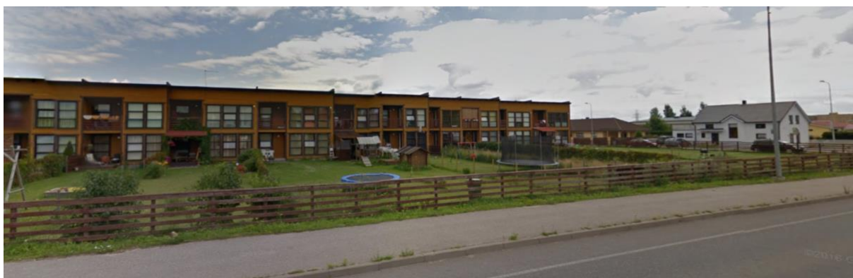
Pilt 4 Elamuala ala planeeringualast idas

Planeeringualast idas, 22253 Rõõmu-Viira teest ida poole, paikneb elumupiirkond üksik-, korter- ja ridaelamutega, moodustades madaltiheda asustusega asumi.