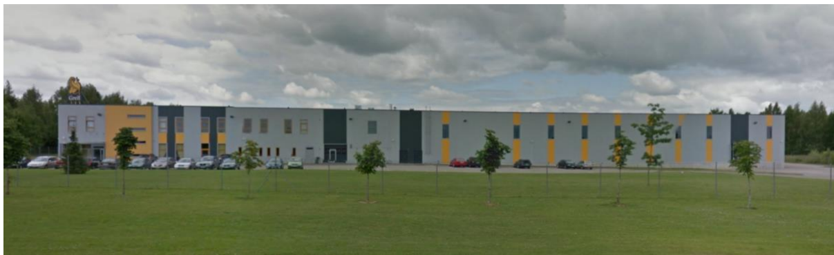
Pilt 3 Trükikoda "Greif" hoone planeeringuala põhjaküljel

Planeeringualast idas, 22253 Rõõmu-Viira teest ida poole, paikneb elumupiirkond üksik-, korter- ja ridaelamutega, moodustades madaltiheda asustusega asumi.