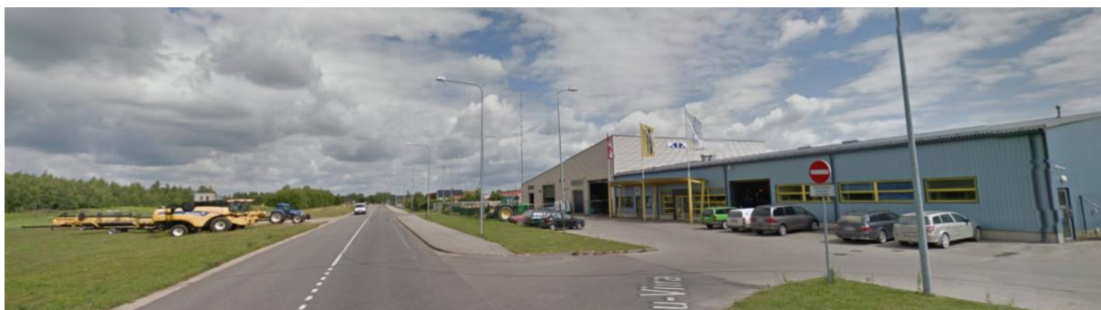
Pilt 5 Kaubandus- ja teenindushooned planeeringualast lõunas

Planeeringualast lõunas, 22253 Rõõmu-Viira teest ida poole asuvad madalakvaliteedilise arhitektuurikeelega kaubandus- ja teenindushooned, mis mõneti ei sobitu kõrvalasuva elamute piirkonna ja lasteaia ruumilise kontseptsiooniga.