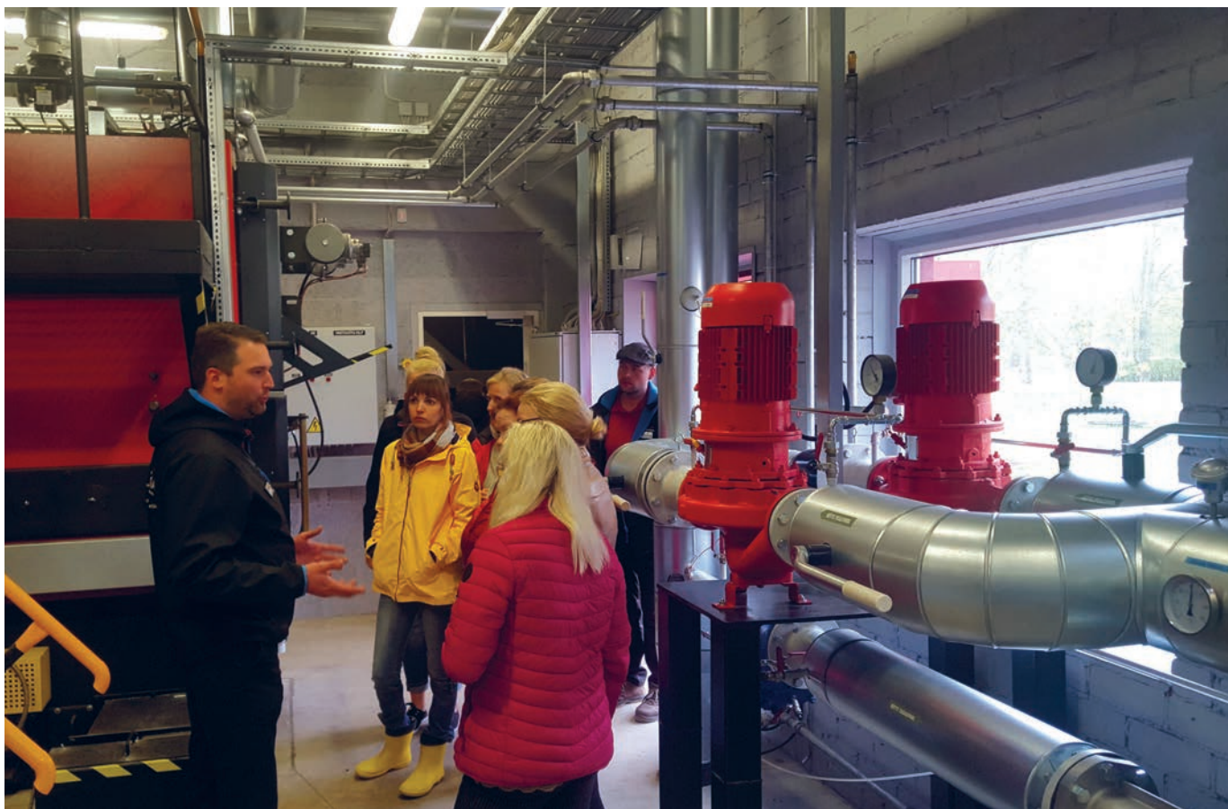
Huvilistel oli võimalus uut katlamaja uudistada.