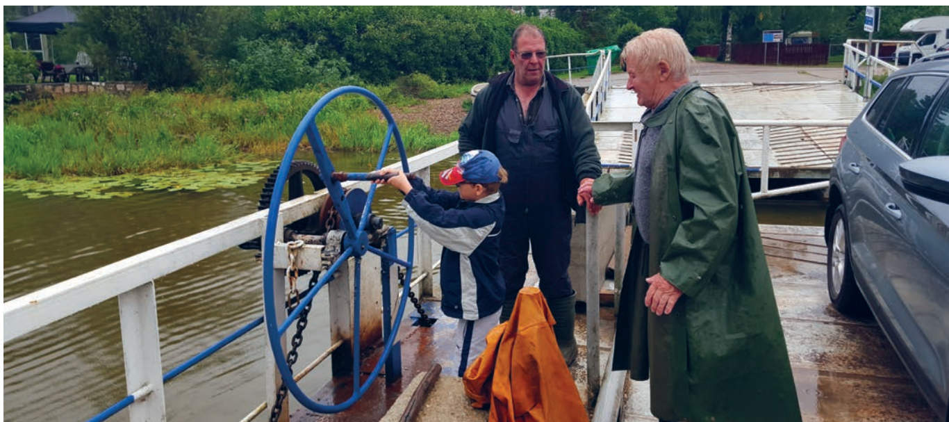
Väikemees proovib, meister õpetab.