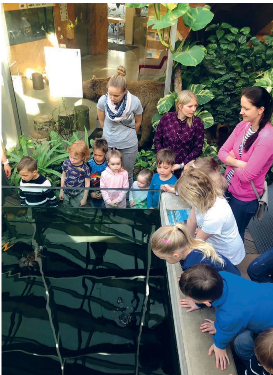
Punakõrv- ja kollakõrv-ilukilpkonnad.