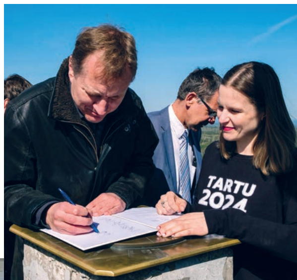
▲ Vallavanem Suure Munamäe tornis koostöölepet allkirjastamas