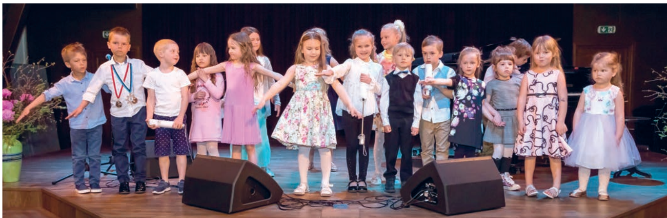
Noorima vanuserühma rõõmsad laululinnud.