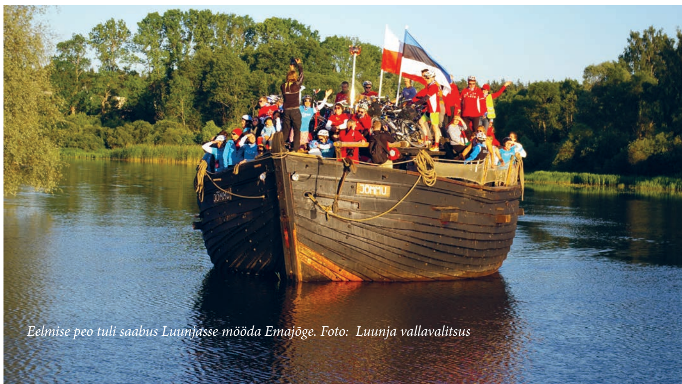
Eelmise peo tuli saabus Luunjasse mööda Emajõe.

Tartumaa Omavalitsuste Liidu kultuurinõunik