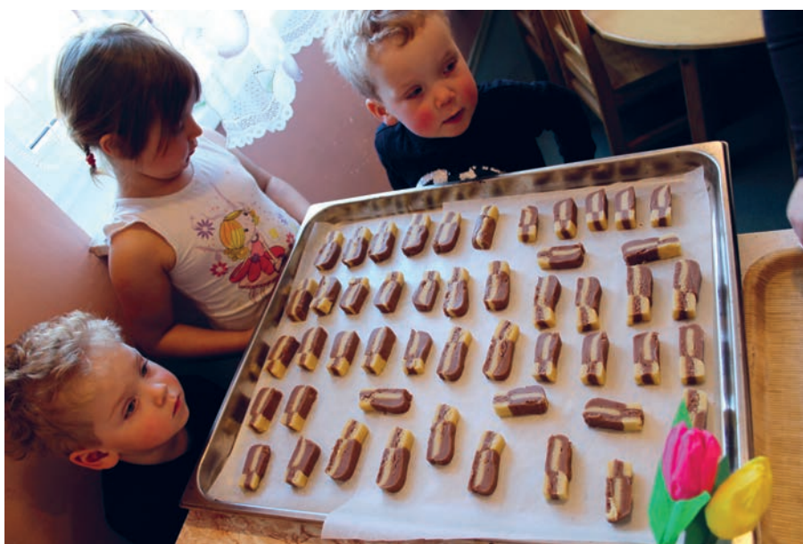
Kavastu maleruuduküpsised.