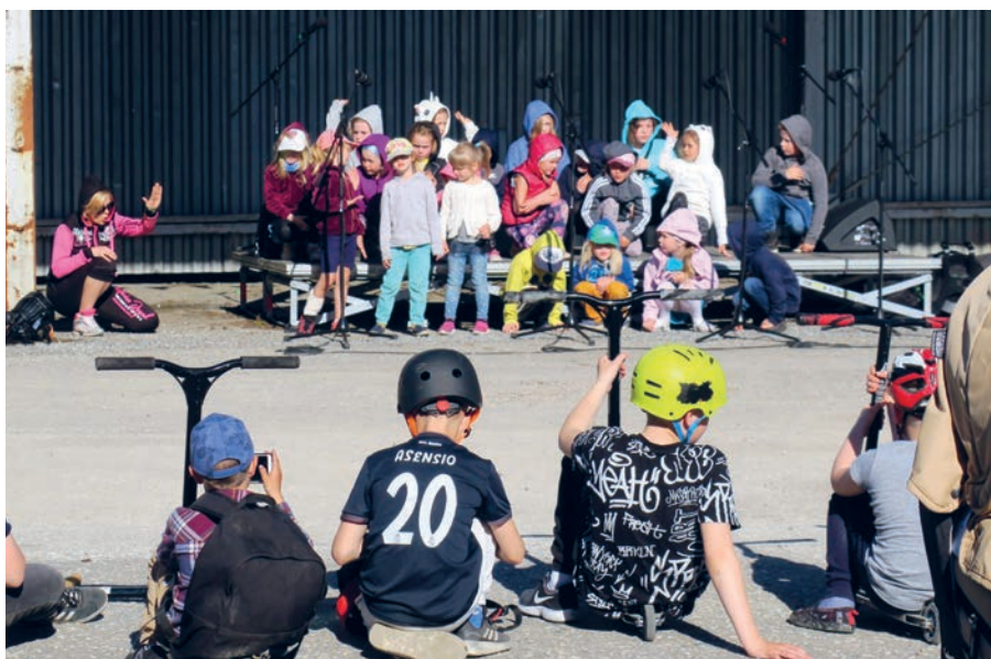
Lohkva Laste Laulumaa esinemine