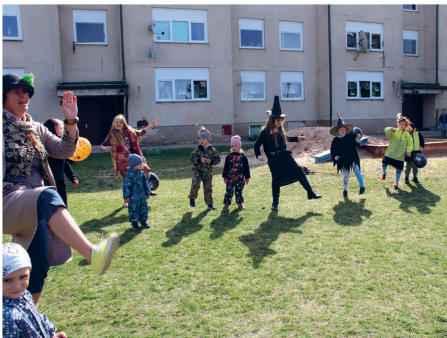
Kavastu nõidade tants