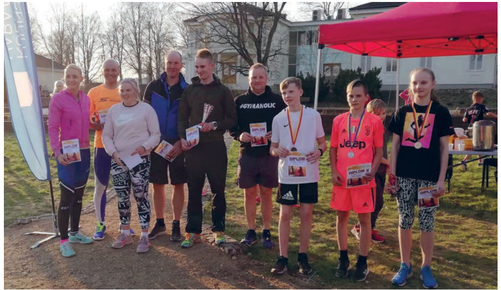
Jüriöö jooksu segavõistkonnad.

Seejärel jooksid juba suuremad lapsed, läbides olenevalt vanusest kas 250 või 450 meetrit, ja jooksuõhtu lõpetasid pere- ja teatevõistkonnad.