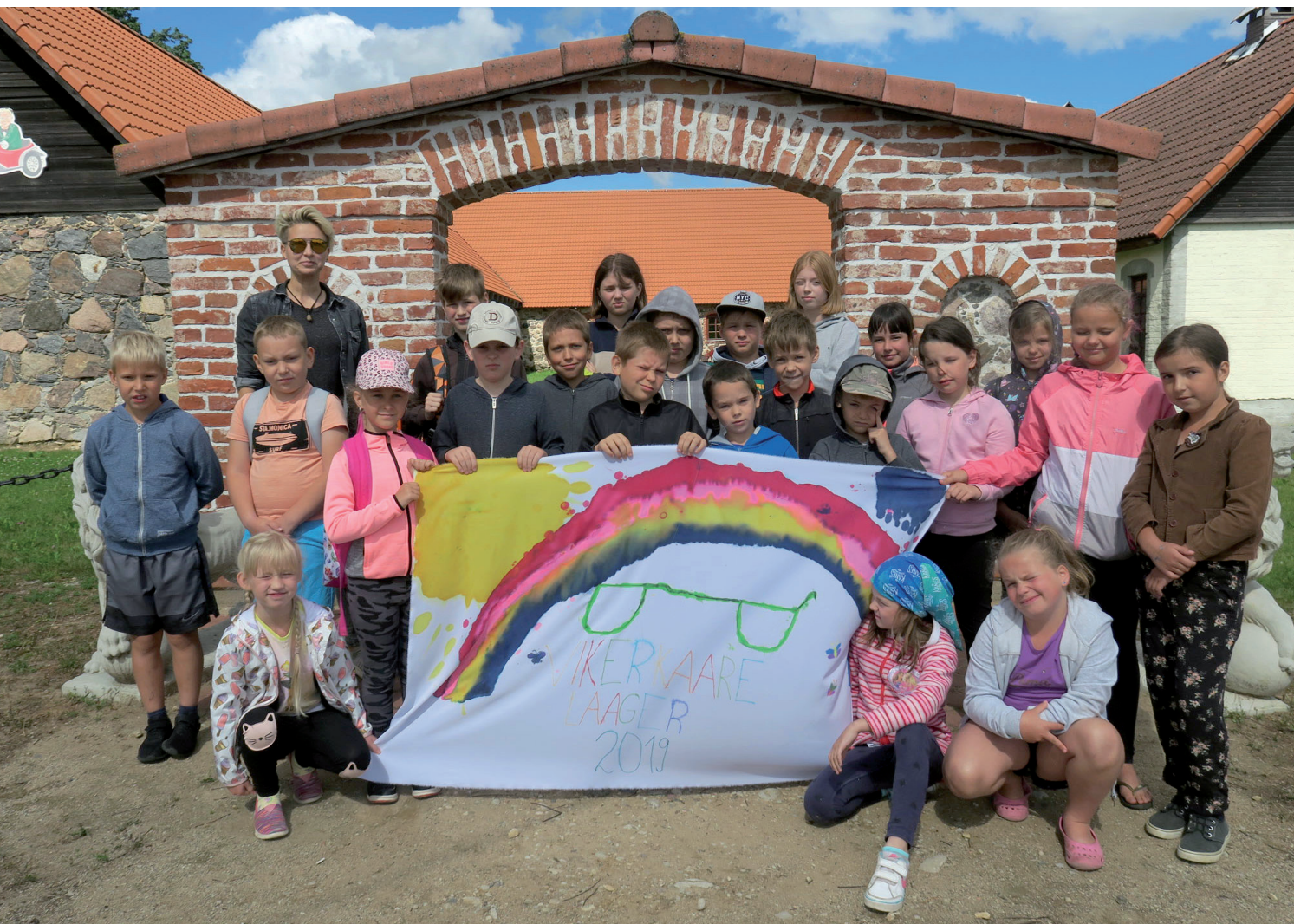
▲ Luunja lastelaagri I vahetus nimega Vikerkaare laager Cantervilla mängumaa väravas.