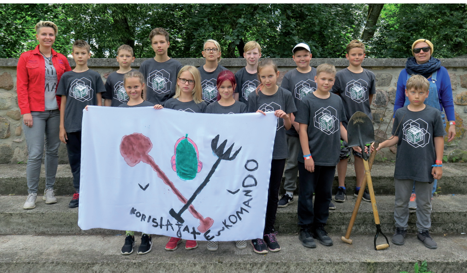
▼ Luunja õpilasmaleva kõige noorem rühm Koristajate Komando.