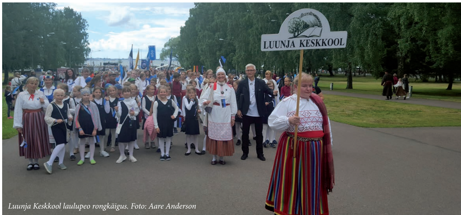
Luunja Keskkool laulupeo rongkäigus.