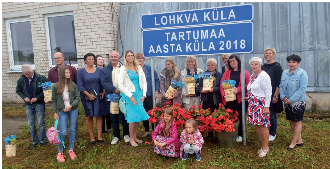
Tartumaa aasta küla 2018 on Lohkva küla.