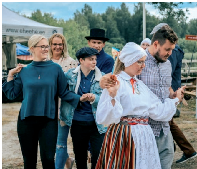
Kodu Uudised Peipsi järvefestival.

Sõideti lodjaga, löödi tantsu, meisterdati, maitsti ehedaid toite ja jookke, avastati Emajõe-Suursood jalgsimatkal.