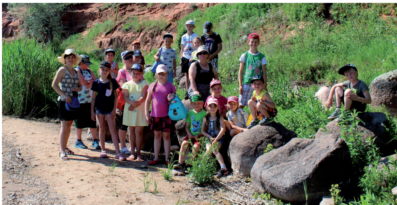
Kavastu kaldapääsukesed Kallastel

KIKi projekti raames külastasime Kallaste kaldapääsukesti. Kallaste keskväljakul võttis meid vastu rõõmsameelne