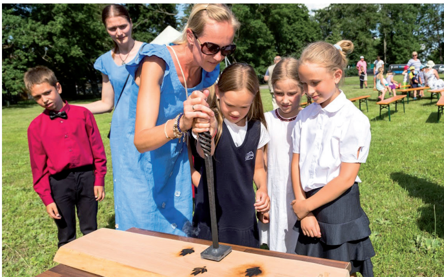
Luunja Keskkooli mudilaskoori esindajad vajutavad Tartumaa tule tulemise sepmärgi lõikelauale, meenutamaks juubelilaulupeo protsessi.