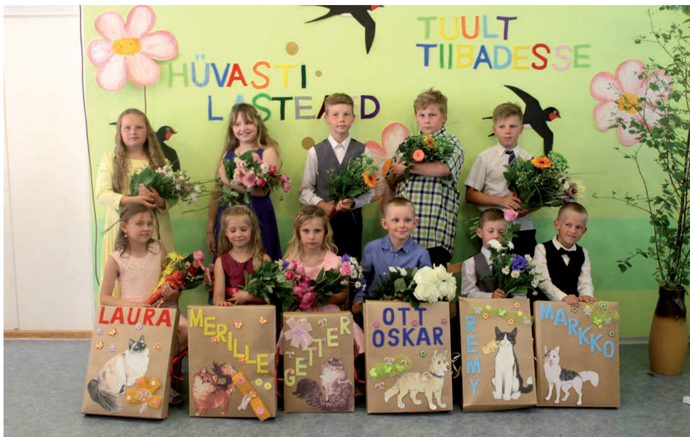
Kavastu 2018/19. öa lõpetajad.