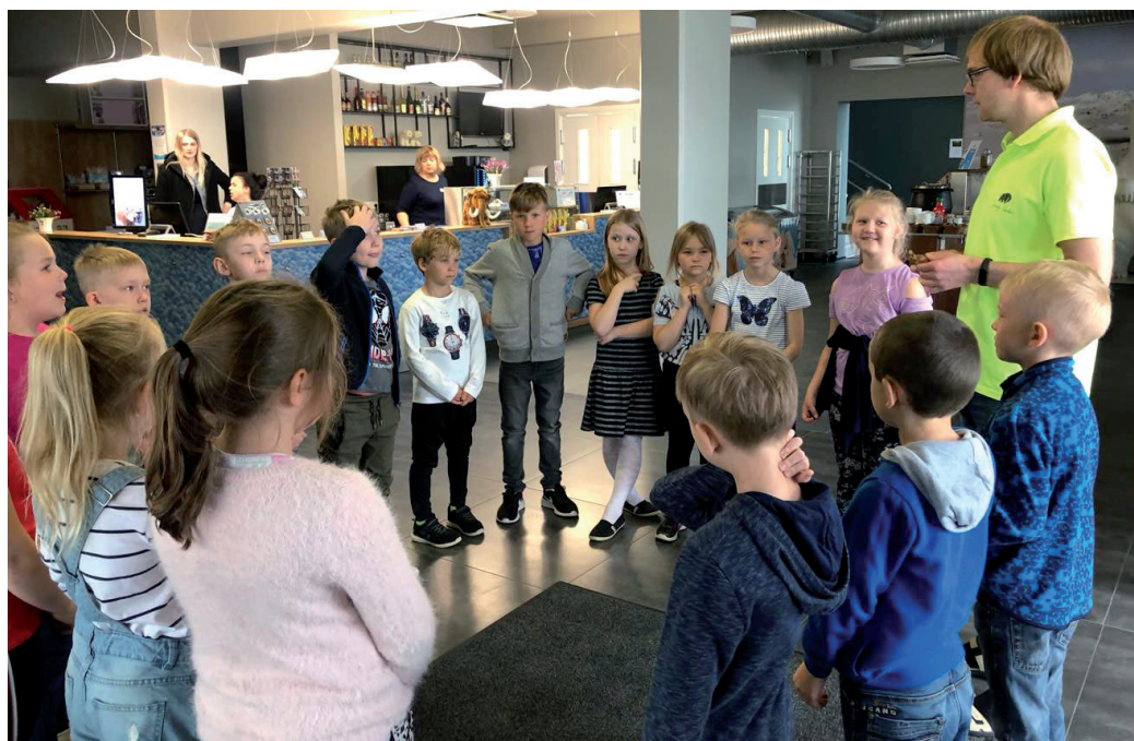
1. klassid Jääaja keskuses.