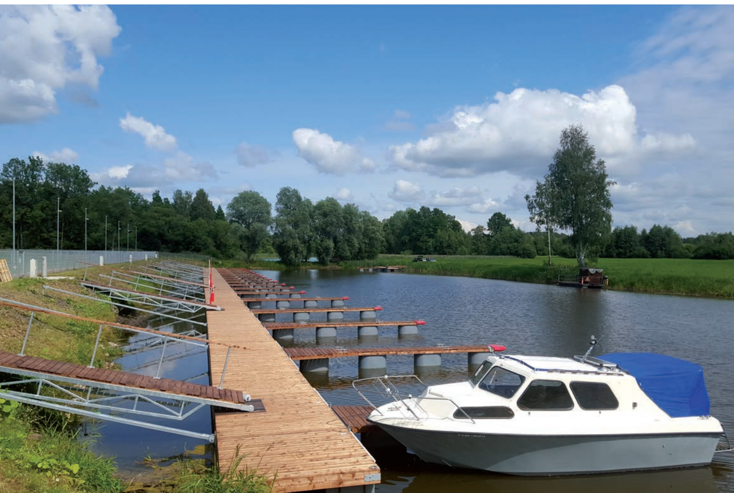
Luunja sadam.