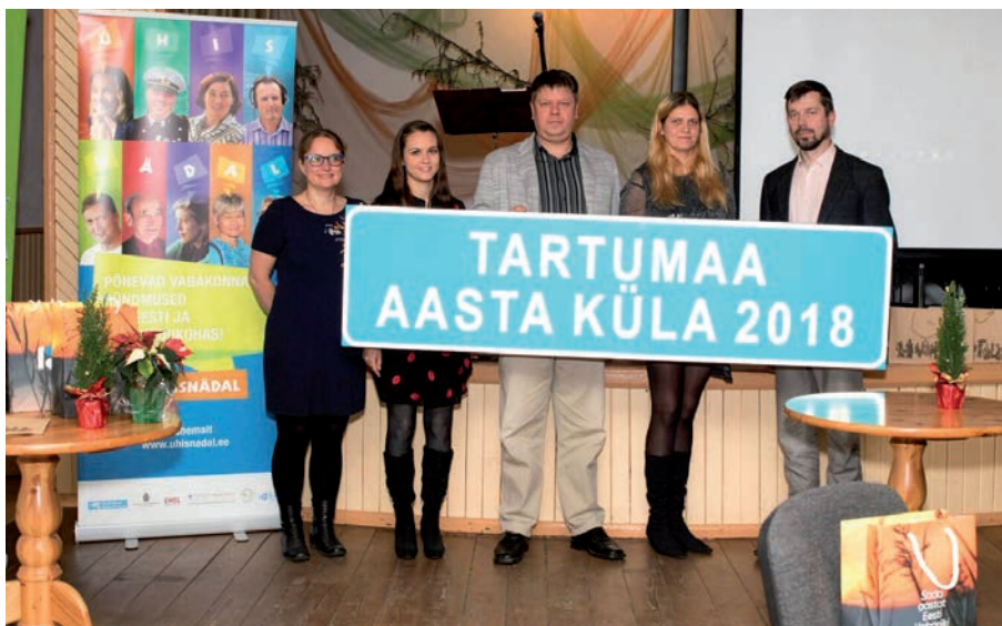
Lohkva Külaseltsi esindajad koos koostööpartneri Luunja Aidarahvas esindajatega Tartumaa aasta küla 2018 tiitlit vastu võtmas.

ulatatakse abikäsi koostöös ettevõtjatega Lohkva lasteaja ja Lohkva raamatukogu õueala korrastamiseks. Lohkvaga seonduvatel tegemistel on ka oluline panus elukeskkonna kvaliteedi parendamisse, osaletakse aktiivselt avalikus elus ja valla tegevustes, loomulikult seisime ka valla iseseisvuse eest.