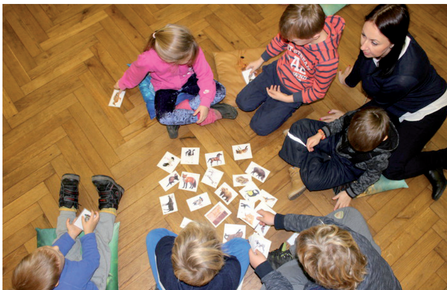
Loodusmuuseumis on helisid!