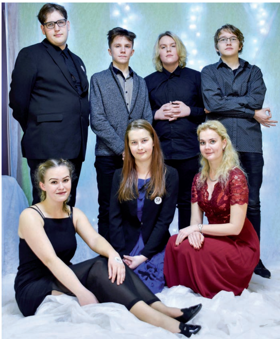
Kanepi Gümnaasiumi sügisball.

21.11.2018 toimus Luunja Kultuuri- ja Vabaajakeskuses Luunja Keskkooli õpilastele ansambli Põhja-Tallinn kontsert. Ettevõtmine leidis aset Eesti suurima kontserdikorraldaja, Sihtasutuse Eesti Kontsert poolt korraldatavate koolikontsertide raames.