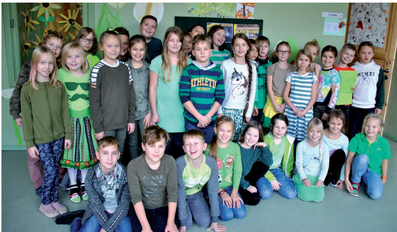
Värvinäda värvid.

Teli Taimre Luunja Keskkoolest huvijuht Külliki Kask eesti keele ja kirjanduse õpetaja Aule Sepp 2.a klassi klassijuhataja