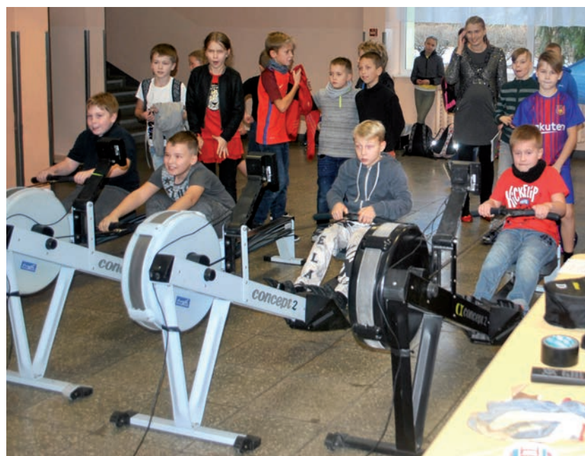
Poisid võistlushoos.

Kaido Linde Luunja Kultuuri- ja Vabaajakeskuse sporditöö spetsialist