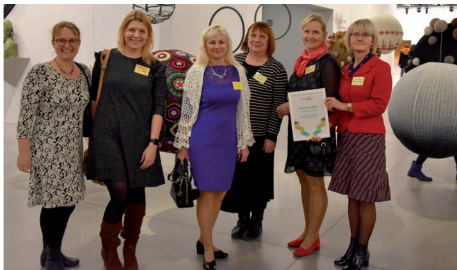
Tublid midrimaalased auhinnaga.