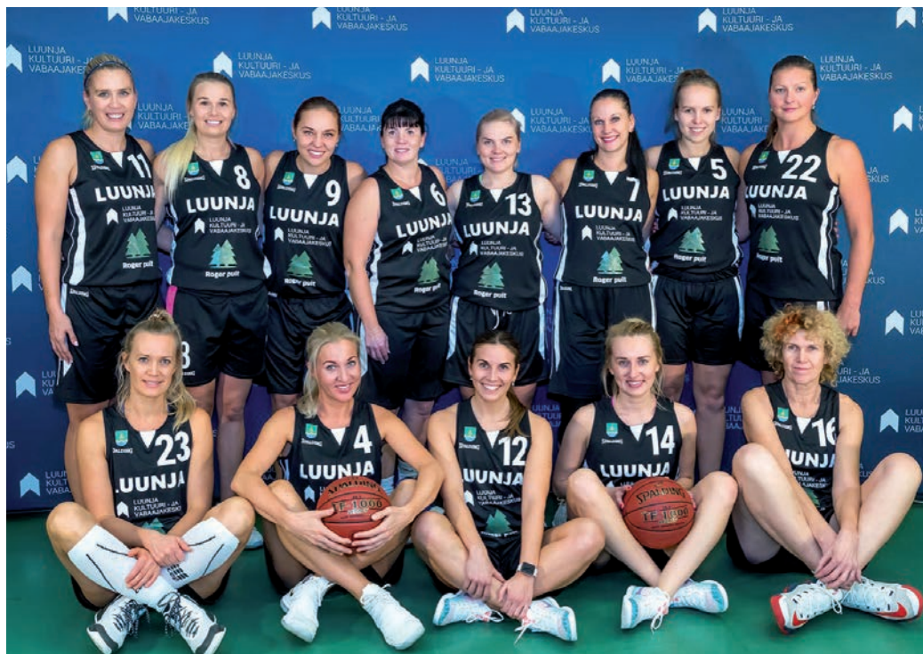
Tubli Luunja valla korvpallinaiskond.