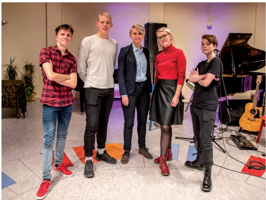
Noorsootöötajate tänuüritusel esines Luunja noortebänd Õhtune Emotsioon.