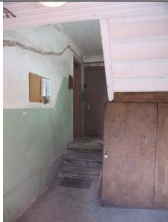
Vaade välisuksest Paremal sobimatu kojakapp