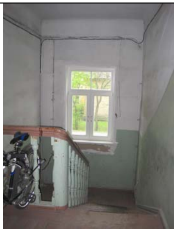
Vaade teiselt korruselt