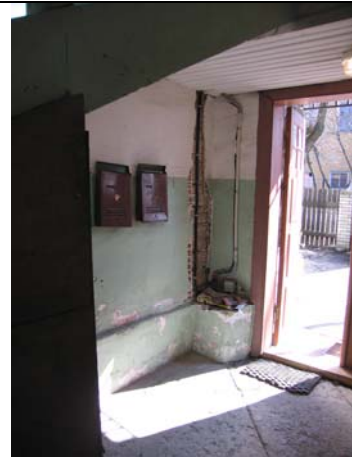
Vaade välisukse suunas