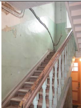
Vaade välisukse suunas