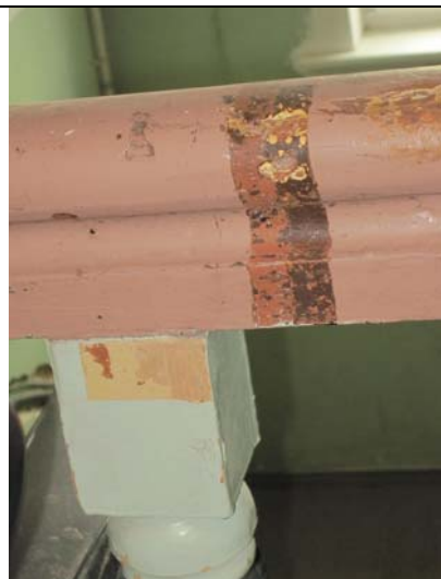
Trepi käsipuul ja balustril avatud sondaaž