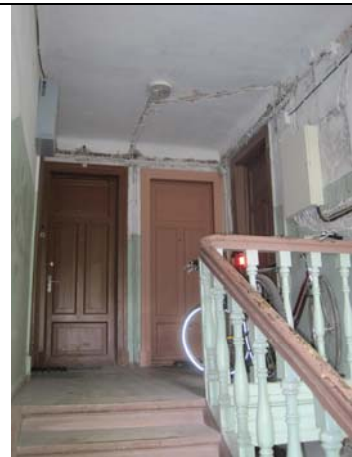
Vaade teisele korrusele