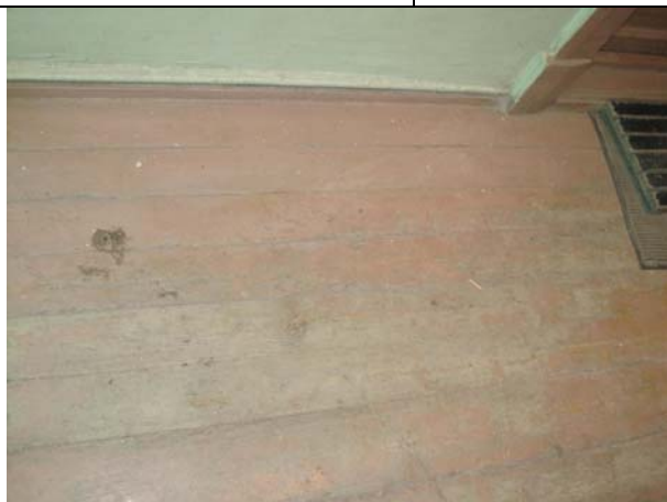
Teise korruse puitpõrand