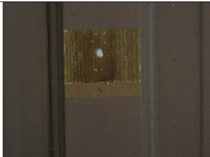
Korteri nr 8 ukselehel avatud sondaaž

Seinad on kaetud trafarettmaalinguga (kõrgus põrandast 150 cm). Trafarettmaaling on teostatud rohelistes toonides. On alust arvata, et avatud trafarettmaaling on sekundaarne ning selle all on veel varasem trafarettmaaling, kuid kuna mõlemad on teostatud lubivärvidega, siis ei ole ilma keerukamate uuringuteta võimalik avada arvatavat algset seinamaalingut.