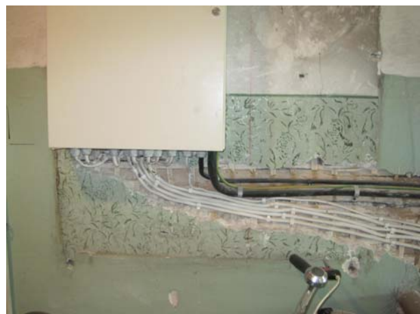
Osa trafarettmaalingust (teisel korrusel)