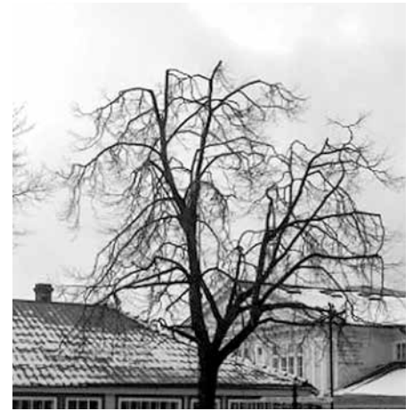
Sama puu pärast võra piiramist.

Inimene on avalikus ruumis aga ikka ise see, kes oma tegevusega kõige rohkem loodusele mõju avaldab ning valesti sekkudes ka pöördumatut kahju tekitab. Põhiline viga, mida tehakse, on puude kõndistamine. See, kuni tänase päevani levinud