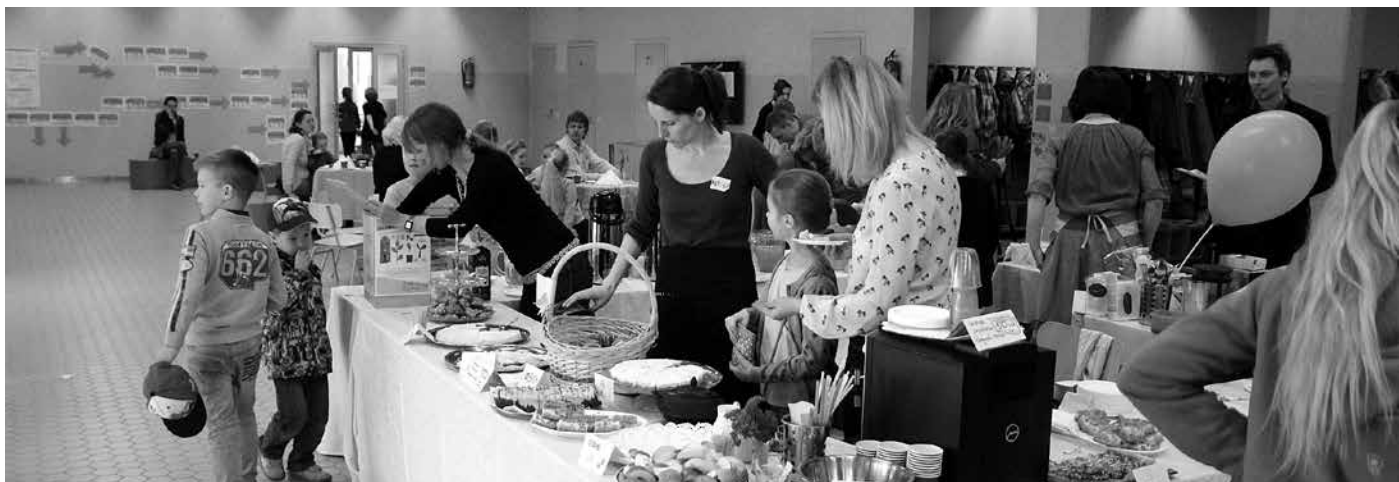
Vanemate annetuskohvikusse jagus mullu nii hea-parema annetajaid kui ka külatajaid. Kohvikuga kogutud annetuste toel on kooli aulaks nüüdseks valmimas lava.