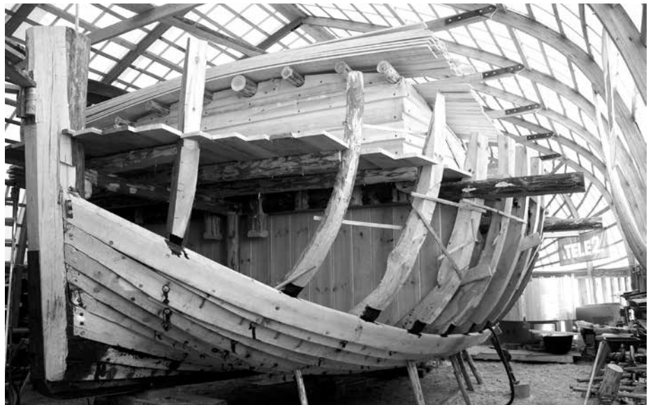
Lodja sünnid oli otsekui õnnelik juhus, teisalt raske töö, mis ei läinud sugugi libedalt.

Kui oleksime ette teadnud selle keerukust, oleksime valinud lihtsama seikluse. Aga õnneks ei teadnud. Ja õnneks leidis palju sõpru-toetajaid, kes häda korral