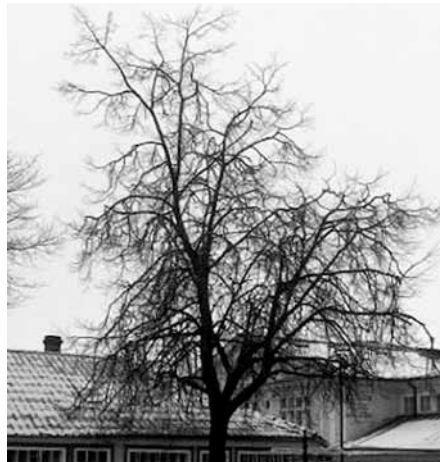
Pärn Kuressaares enne võra piiramist.

Me ei saa kuidagi takistada seda, et avalik ruum meie ümber areneb pidevalt. Ikka