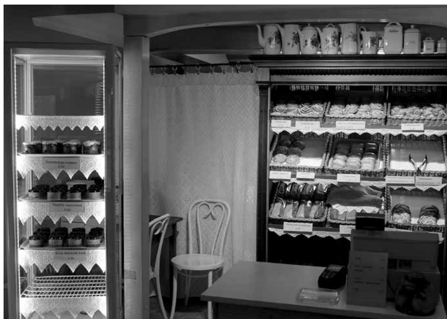
Pilguheit Saiasahwrisse nüüd.