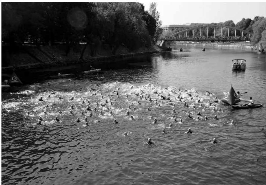
Keset Emajõge tohib ujuda ainult rahvapordiürituste ajal, mil jõgi laevaliikluseks suletakse. Pildil Tartu Milli igamehetriatloni start Sisevete Saatkonna juures 2015. aastal.

Seadus ei käsi paadisõidu ajal päästeveste selga panna, need peavad olema pardal kättesaadavas kohas. Väikeste lastega või külmal ajal sõites on tark vestid siiski peale tõmmata – esiteks annavad need sooja, ja teiseks – õnnetus ei hüüa tules!