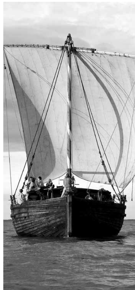
Esimese 10 aastaga on Jõmmu sõidutunud Tartu linna jagu reisijaid.

2012. aastal algas Lodjakojas suure, kahemastilise lodja ehitus. Elu tegi aga korrektuurid – lodjaehituses tuli väike paus,