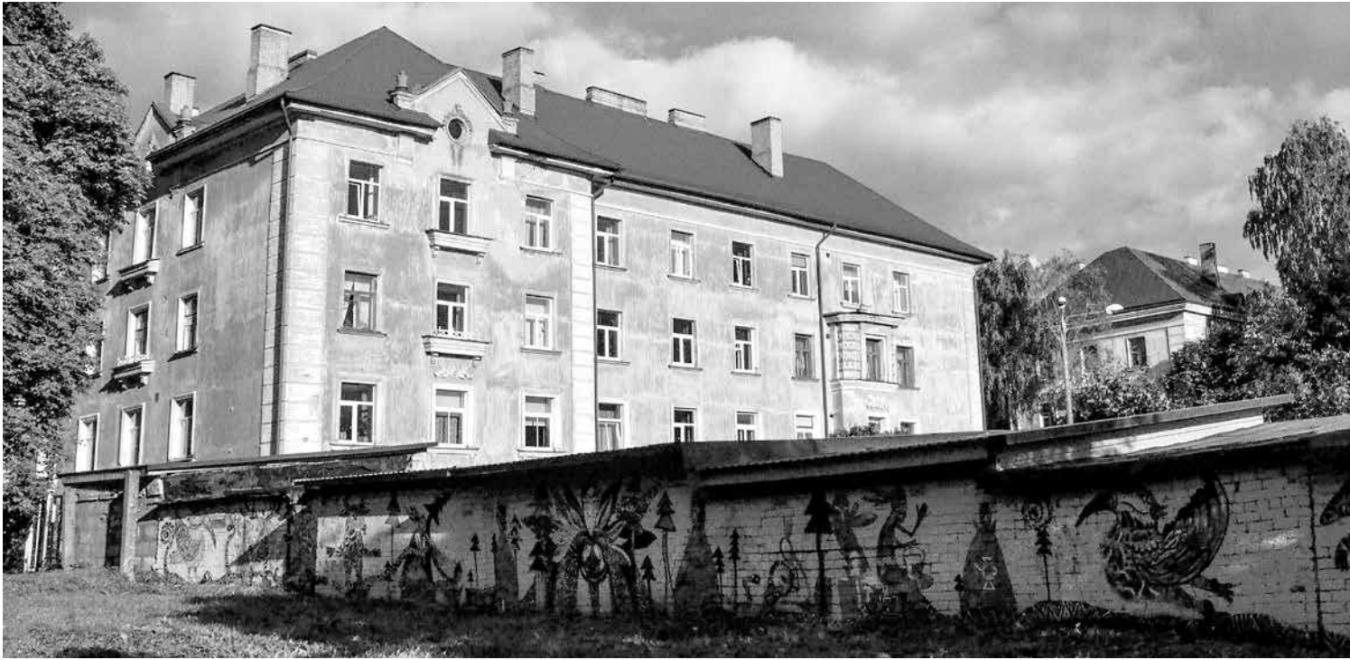
Eelmisel kevadel algas ohvitseride pargi korrastamine ning kunstnikud maalisid garaazide tagaseinale värviküllased tegelased. Sel aastal