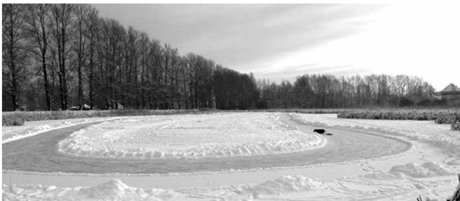
400 meetrit puhast uisurõõmu Supilinna konnatiigil.

Ei tea. Labida edasi-tagasi tassimine oli selle asja juures kõige väiksem mure. Aga jah, kui oleks neid abilisi rohkem olnud, siis ehk mõnest kõrvalmajast oleks ker-