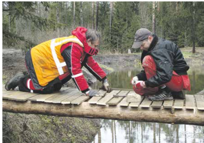
Sobiva tasakaalu leidmine töö ja seltsielu vahel on iga talgupäeva õnnestumise võtmeküsimus. Sõesauna turismitalgu talgutel Harjumaal see mullu õnnestus.

Kindlasti ei saa üle ega ümber ka materjalide taaskasutusest, millest sel aastal tuleb talgutevalmistuse ajal rohkem juttu. Nii nagu veeohutussest valmistamisel saab kasutada vanu euroaluseid või muud seisma-