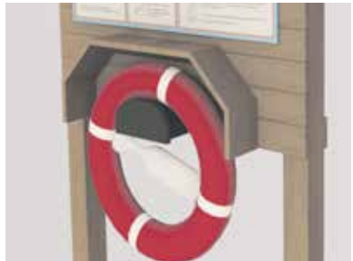
Merekultuuriaastal kutsume talgutel veeohutuse stende rajama