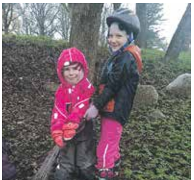
Väikesed talgulised Kuremaa talgutel

Koostegemise rõõm väljendat talgutegudes