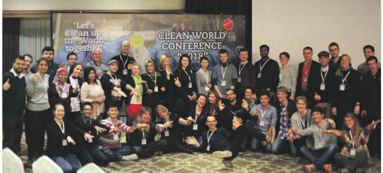
Üleilmse koristuspäeva ettevalmistused algasid jaanuari lõpus Teeme Ära Puhta Maailma konverentsil Türgis Bursas.