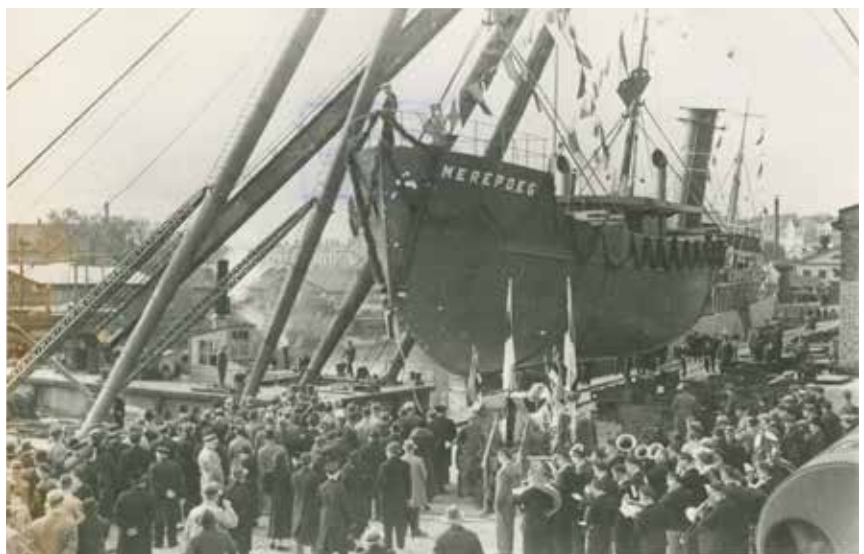
Aurulaeva "Merepöeg" vettelaskmise tseremonia Tallinnas 1937. aastal.

Olen seisukohal, et maailma muutmist saab alustada enda ninaisest. Nii on ka puhta ümbruse ja korra hoidmisega – Teeme Ära talgud on võimas algatus selleks.