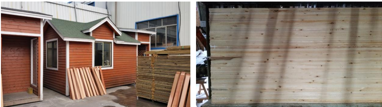
Foto 6-7. Puitmaju ja puitdetailide tootev ettevõtte Fenftai Forests.

Koostöö tegemiseks/algatamiseks oleks Eesti ettevõtetal vaja (kohalikke) referentse. Reisi käigus selgus, et ühe segmendina saaks sellele turule müüa „smart home“ tüüpi hooneid. Hea näitena saab kasutada Eesti ettevõtet Saare Ere. See, et Eesti ettevõtte on Hiinas juba kohal, annab kindlasti meie mainele kõvasti juurde ning soosib meid kui tõsiseltvõetavat partnerit.