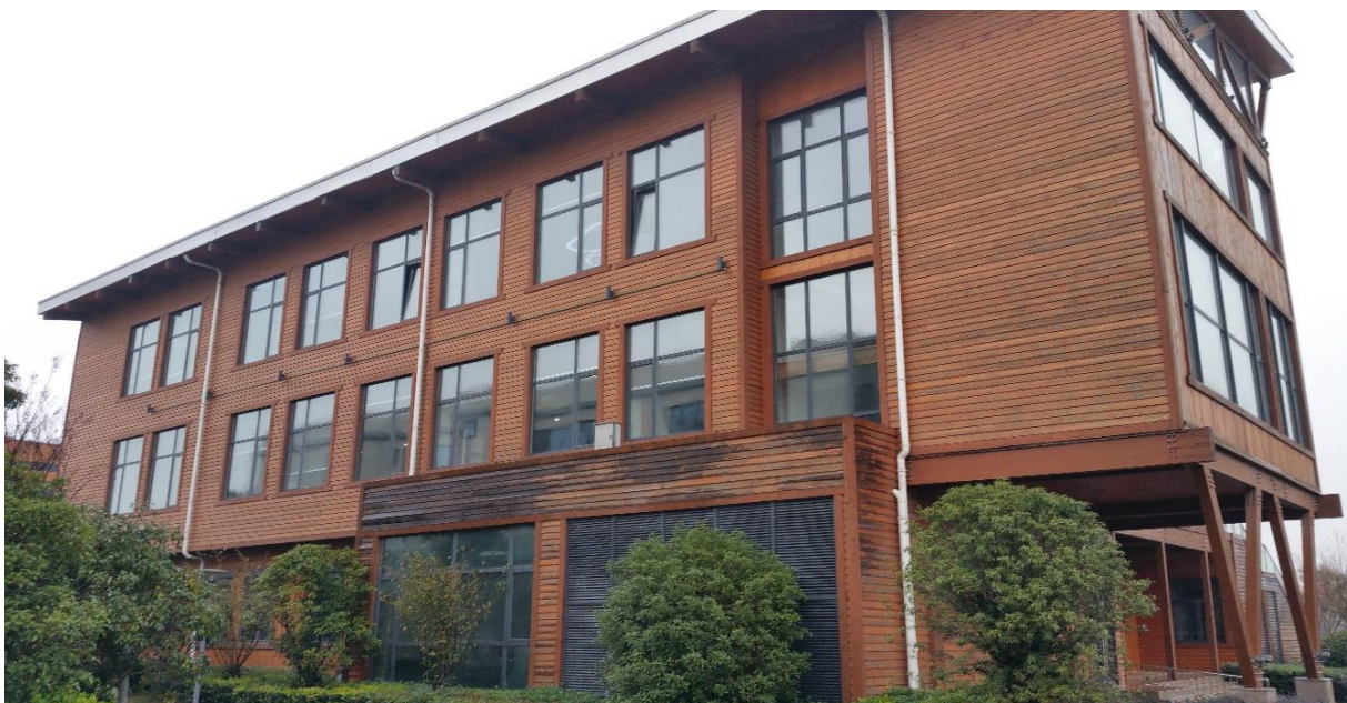
Foto 3. Puidust näidismajad "Rohelisel alal", tootjaks Saksa ettevõtte Good House.

Päeva teises pooles tutvustasime oma projekti puittoodete importijatele ja riigiametnikele. Huvitav oli see, et eramandis olev mets Soomes tekitas kohalikes palju elevust. Võib olla sellepärast, et Hiinas omab ja kontrollib kõike riik.